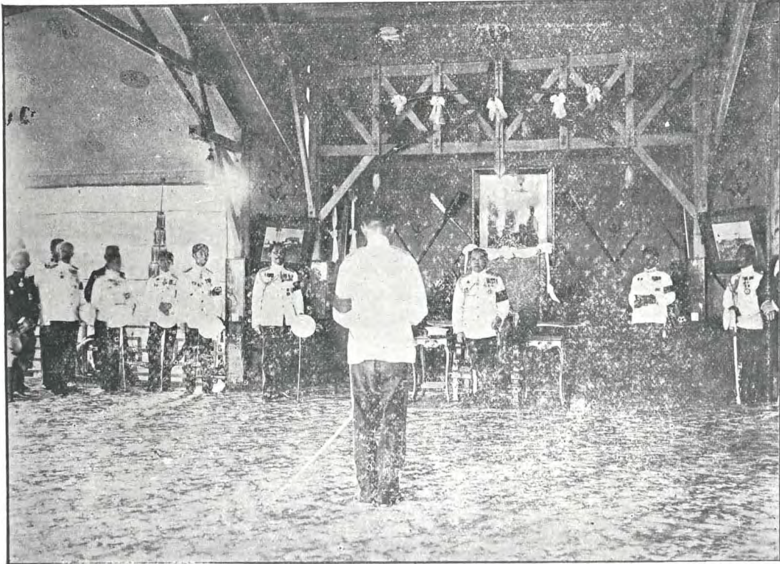
ถ่ายเมื่อดำรงตำแหน่งเสนาบดี กระทรวงเกษตรราชการ กำลังอ่านคำกราบบังคมทูลในการเปิดการแสดงกลสิกรรมและพาณิชการ ครั้งที่ ๒ ( พ.ศ. ๒๔๕๔ )