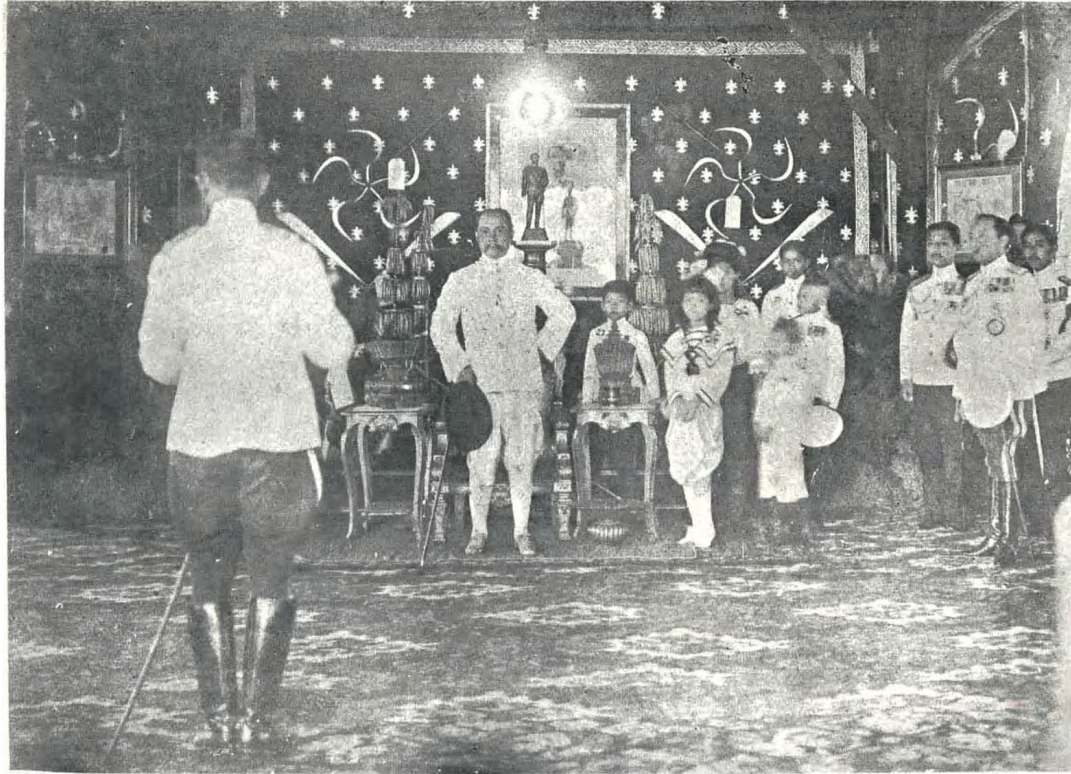
ถ่ายเมื่อดำรงตำแหน่งเสนาบดี กระทรวงเกษตรราธิการ กำลังอ่านคำกราบบังคมทูลในการเปิดการแสดงกสิกรรมและพาณิชการ ครั้งที่ ๑ ( พ.ศ. ๒๔๕๓ )