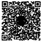
หนังสือนัดประชุม และระเบียบวาระการประชุม สภาผู้แทนราษฎร

เอกสารประกอบการประชุมสภาผู้แทนราษฎร ได้เผยแพร่ทางสื่ออิเล็กทรอนิกส์ ตามข้อบังคับฯ ข้อ ๒๑ วรรคหนึ่ง เรียบร้อยแล้ว โดยท่านสมาชิกฯ สามารถอ่านเอกสารประกอบการประชุมได้ โดยการสแกน QR Code หรือทาง www.parliament.go.th