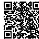
เอกสารประกอบ การพิจารณา สำนักวิชาการ