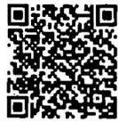
บันทึกการประชุมสภา สำนักแรงงาน การประชุมและชวเลข