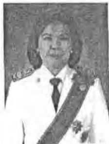
๔๓. นางศรีวิการ์ เมฆวัชชัยกุล ที่ปรึกษาสถาบันส่งเสริมการสอนวิทยาศาสตร์ และเทคโนโลยี (สสวท) และอดีตรองปลัดกระทรวง ศึกษาธิการ ระดับ ๑๐