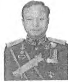
๖. พลโท พีระพงษ์ มานะกิจ ที่ปรึกษาสำนักงานปลัดกระทรวงกลาโหม กระทรวงกลาโหม