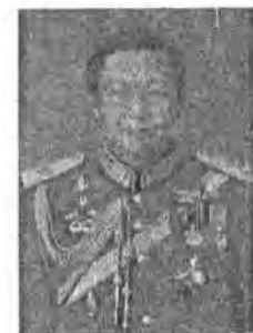
๔๔. พลเอก สุกิจ ชมะสุนทร ที่ปรึกษาพิเศษ กองบัญชาการกองทัพไทย