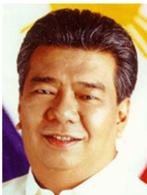
ประธานวุฒิสภาชั่วคราว นายแฟรงคลิน ดริลลอน (Mr. Franklin Drillon)

- ประธานวุฒิสภาลาออก ถูกถอดถอน ตาย หรือไม่สามารถปฏิบัติหน้าที่ได้อย่างถาวร