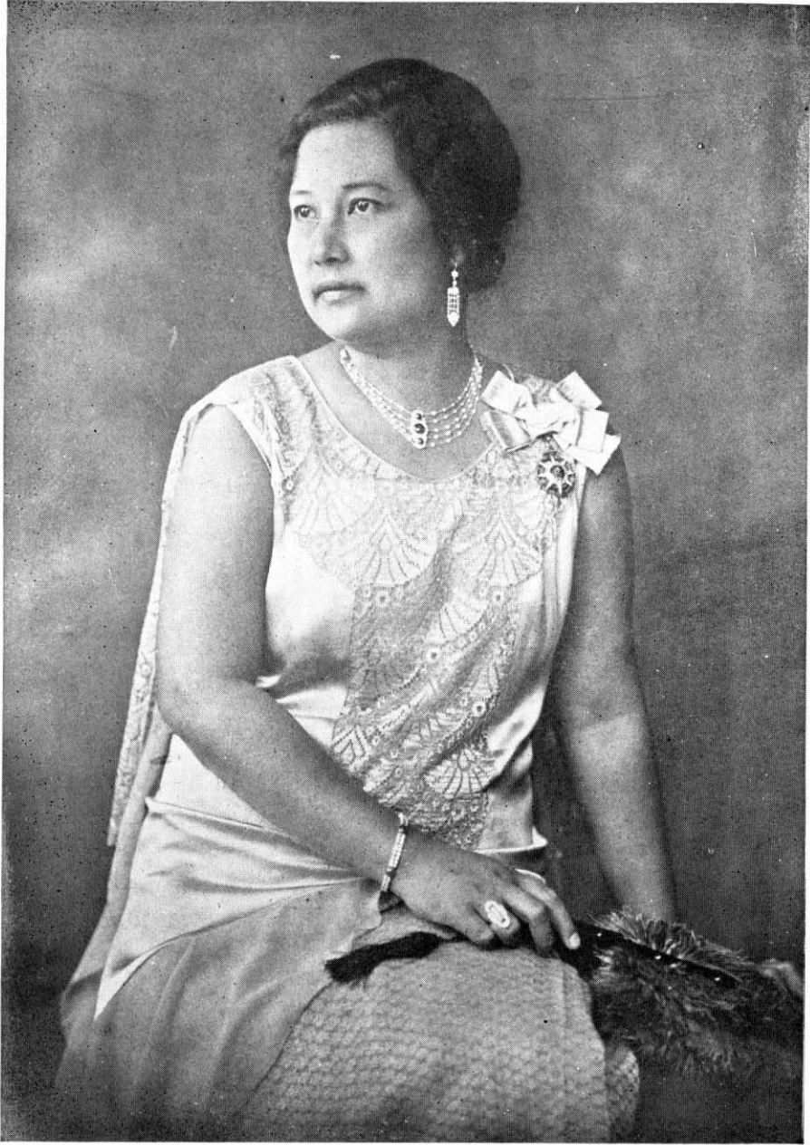
ท่านผู้หญิงน้อมศรีธรรมมาธิเบศ