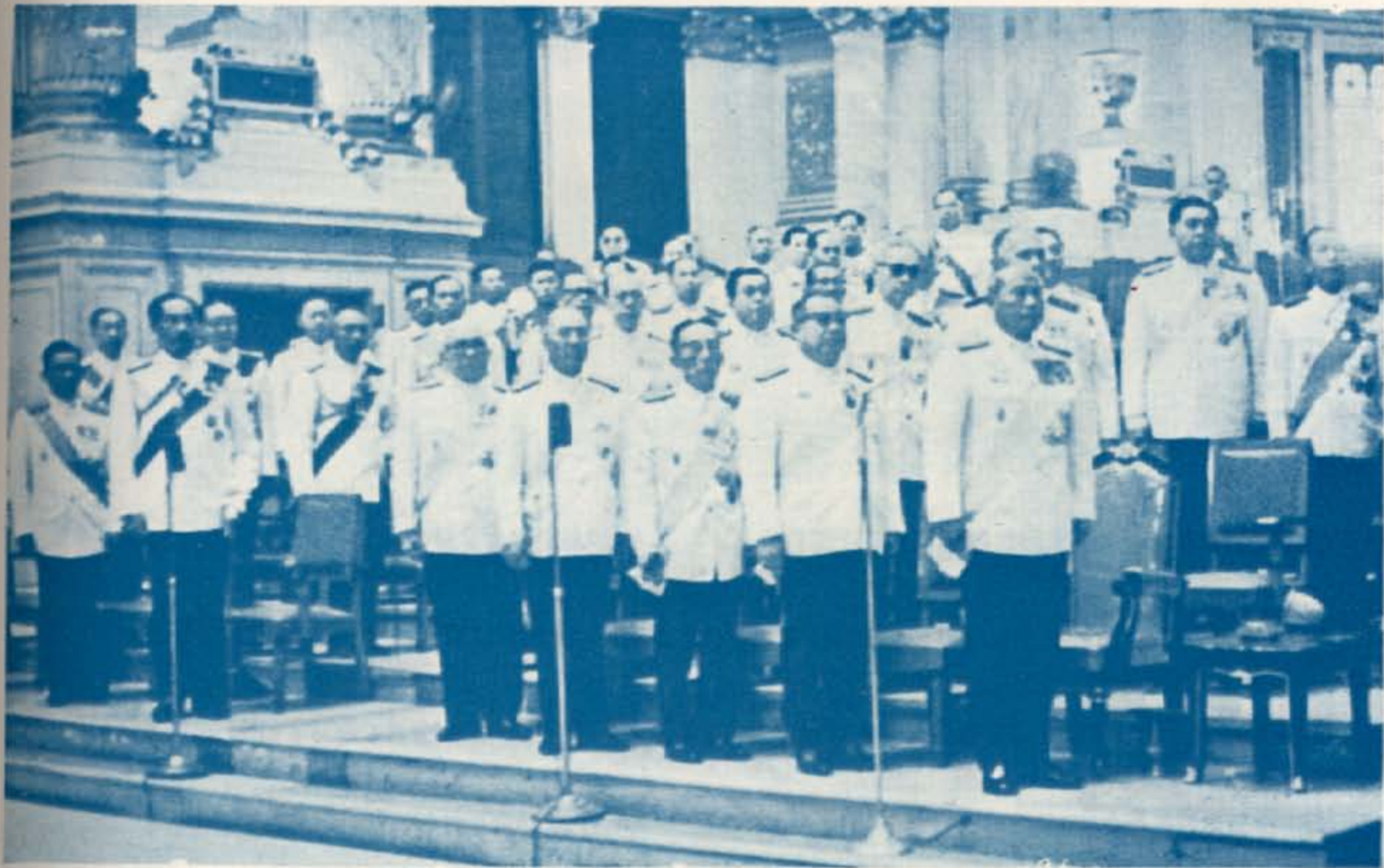
คณะรัฐมนตรี และสมาชิกวุฒิสภา เฝ้าทูลละอองธุลีพระบาท ในรัฐพิธี เปิดประชุมรัฐสภา