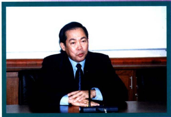
นายปราโมช รัฐวินิจ รองอธิบดีกรมประชาสัมพันธ์