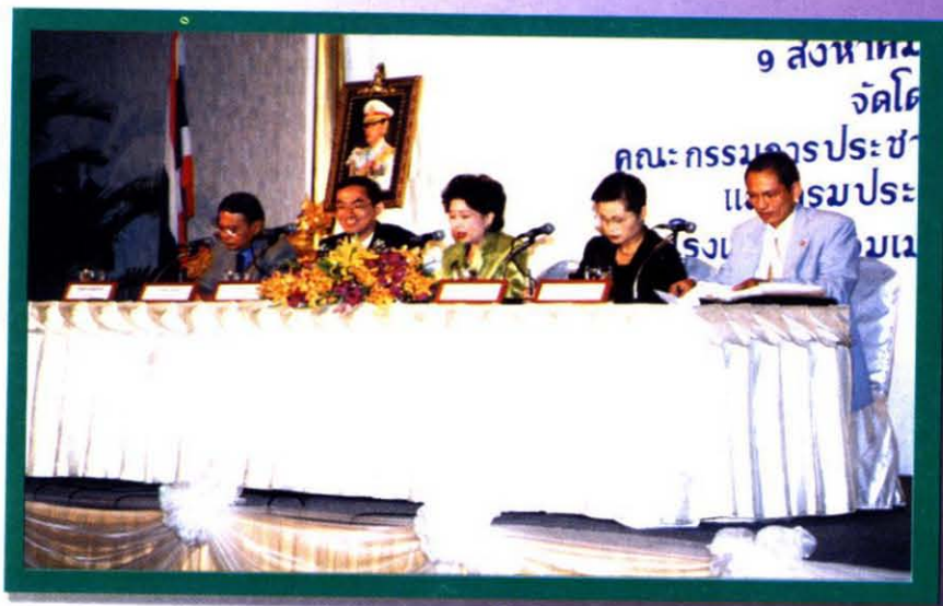
วิทยากรอภิปราย