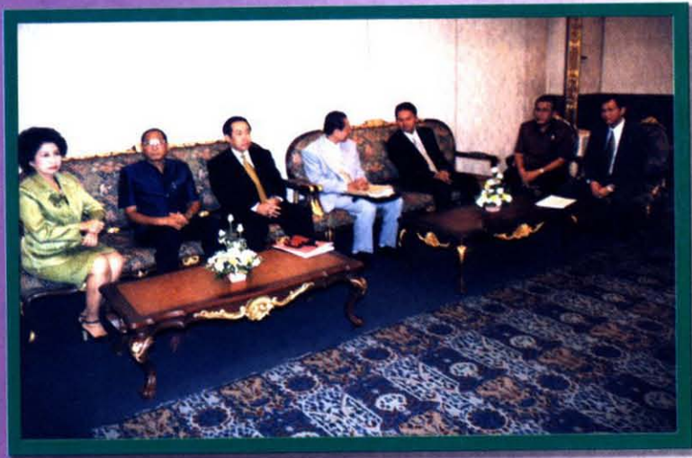
ผู้บริหารระดับสูงและกรรมการ กปช.