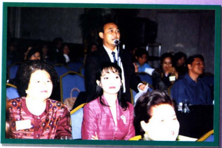
ผู้เข้าร่วมสัมมนา