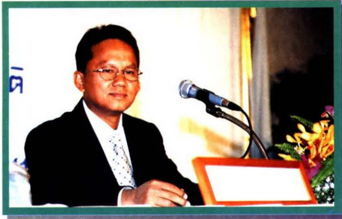
นายสมศักดิ์ เทพสุทิน รัฐมนตรีประจำสำนักนายกรัฐมนตรี