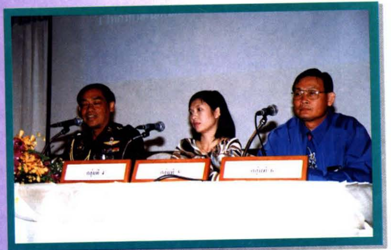
นำเสนอผลงานของแต่ละกลุ่ม