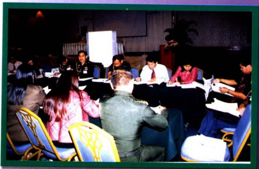
แบ่งกลุ่มย่อย