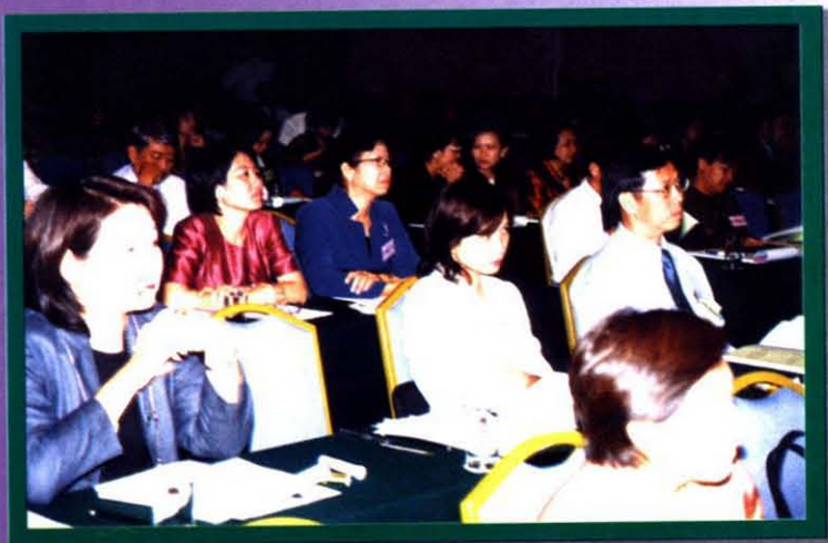
ผู้เข้าร่วมสัมมนา