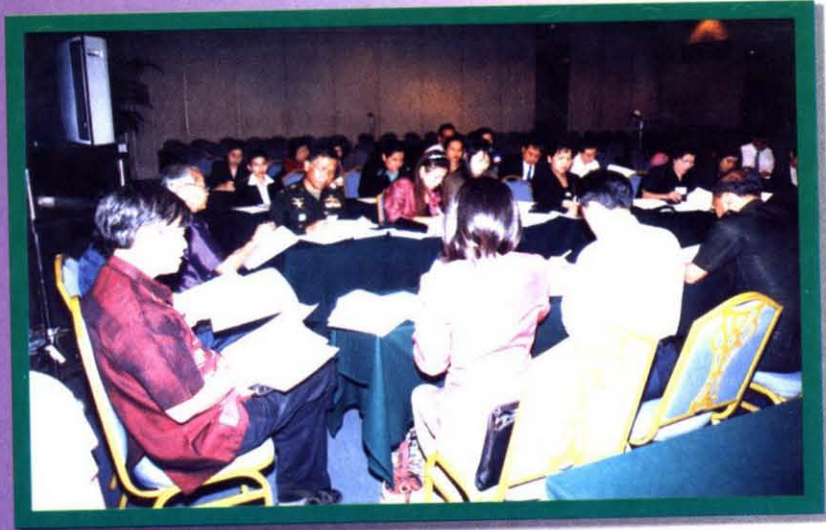
แบ่งกลุ่มย่อย