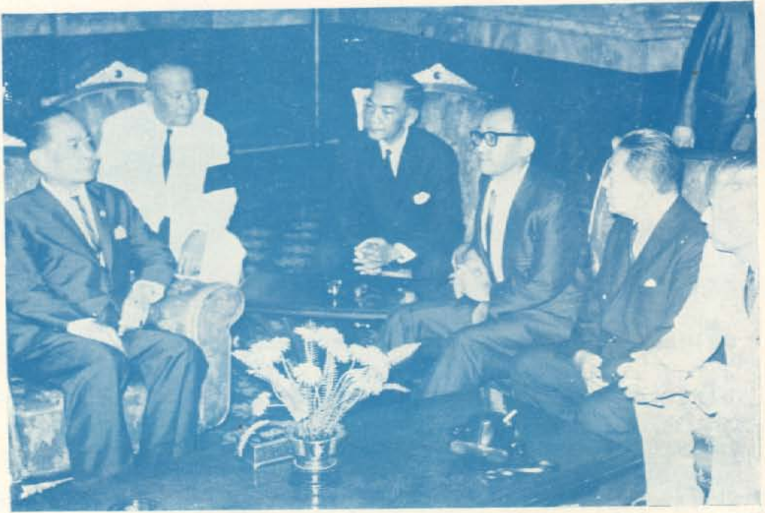
ซึ่งจะไปประชุมสหภาพรัฐสภา ครั้งที่ ๕๕ ณ กรุงเตหะราน ประเทศอิหร่าน รัฐสภาเกาหลี ในโอกาสนี้ด้วย