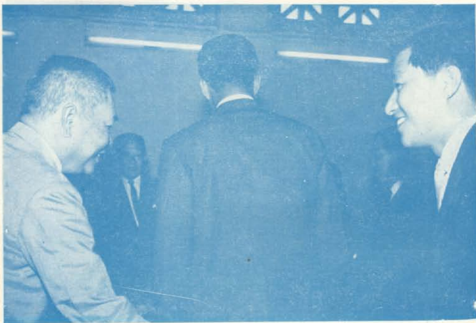
๑พล.๑ รองประธานสภาร่างรัฐธรรมนูญ และสมาชิกสภาร่างรัฐธรรมนูญ ได้มาร่วมต้อนรับคณะผู้แทน