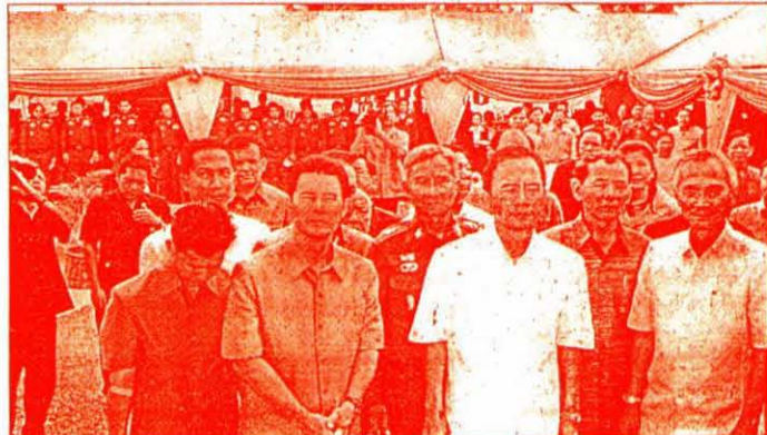
จากสุวัจน์ ฉีกฝักออก

นี่คืออุทาหรณ์รายหนึ่ง ของผู้ที่ถูกกลุ่มนายหน้าหลอกลวงไป แต่ตอนนี้ไปกระทรวงแรงงานได้ประชุมร่วมกับสำนักงานตำรวจแห่งชาติ กระทรวงมหาดไทย และถือ เป็นนโยบายในการปราบปรามบุคคลที่มาหลอกลวงหาคนไปทำงานต่างประเทศอย่างจริงจัง เราจึงต้องจัดตั้งศูนย์เฉพาะกิจในการปราบปรามเรื่องนี้ โดยเฉพาะทางภาคอีสาน