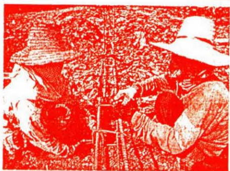
แรงงานเด็กและสตรีวัยมีอยู่เต็มบ้านเต็มเมือง ส่วนหนึ่งถูกทารุณและเอารัดเอาเปรียบ กระทรวงแรงงานเดือนนายจ้างที่ใช้แรงงานเหล่านี้ ‘ระวังจะถูกกักกันทางด้านการค้า’

“โครงการนี้ถือเป็นโครงการที่ดี ที่กรมแรงงานเล็งเห็นถึงความสำคัญของแรงงานเด็กและสตรี และคนพิการ กระทรวงกำลังดำเนินนโยบายให้คนพิการได้มีโอกาสทำงานเหมือนคนปกติ โดยจะประสานกับบริษัทต่างๆ ที่มีคนงาน 200 คนต้องรับผู้พิการเพื่อเข้าทำงาน 1 คน ในกระทรวงเองก็มีแรงงานพิการทำงานเป็นตัวอยู่อยู่แล้ว ส่วนแรงงานเด็กและสตรีก็จะรณรงค์ให้นายจ้างละเมิดสิทธิแรงงาน พร้อมทั้งช่วยเหลือแรงงานที่ได้รับบาดเจ็บเดือดร้อนต่อไป สำหรับโครงการที่จะดำเนินต่อไป คือการผลักดันให้มีวันแรงงานสตรีในวันที่ 8 มีนาคมนี้” นางปรีดา กล่าว