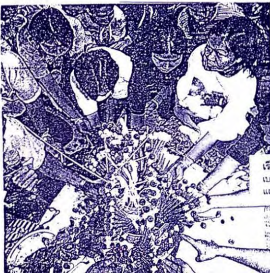
เรียกขวัญมือ : มือสมัครเล่นคนเจ็ดพิชัยบุรีสุวัจน์ให้แก่กลุ่มมือแรงงานเบต แอนด์ บาส การ์เมนต์ ที่ปักหลักประท้วงอยู่ที่กระทรวงแรงงาน เพื่อเรียกขวัญและกำลังใจกับกลุ่มผู้ชุมนุม

ด้านนายสุวัจน์ ลิปตพัลลภ รัฐมนตรีว่าการกระทรวงแรงงาน กล่าวว่าการจ้างแรงงานต่างด้าวที่ผิดกฎหมายจะมุ่งเน้นให้ดำเนินการเอาผิดกับนายจ้างหรือสถานประกอบการเป็นหลัก เนื่องจากหาไม่มีผู้จ้างแรงงานต่างด้าวเข้าทำงานก็ไม่มีแรงงานต่างด้าวเกิดขึ้น และให้มีการขยายผลการสกัดกั้นของแรงงานต่างด้าวที่ถูกจับกุมด้วย ใครเป็นคนนำพาและได้มีการจ่ายเงินให้กับผู้ใด โดยจะขอความร่วมมือจากสำนักงานตำรวจแห่งชาติในการตรวจสอบและขยายผล