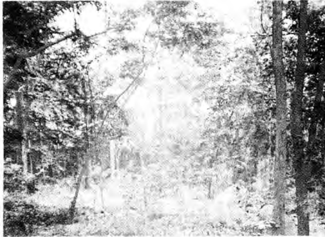
วัดหัวเขาสมอคร้า