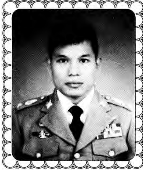
พ.ต.อ.ภูมิเพชร พิพัฒน์เพชรภูมิ