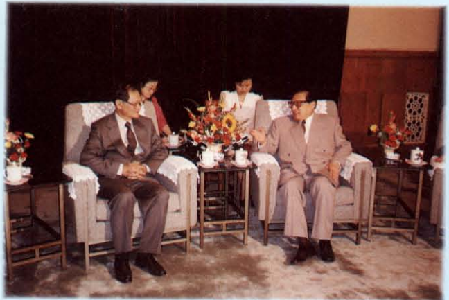
ประธานวุฒิสภา และคณะฯ เข้าพบและสนทนาแลกเปลี่ยนความคิดเห็นกับ ฯพณฯ นายเฉียว ลี ประธานสภาประชาชนแห่งชาติ

เยี่ยมชมหลุมหลบภัยของกรุงปักกิ่ง (House for Qianmen People's Defence Project) เยี่ยมชมวัดหลิงหยิน (Lingyin) วัดเก่าแก่ของเมืองหางโจว เยี่ยมชมพิพิธภัณฑ์ใบชาแห่งชาติจีน ชมทัศนียภาพของทะเลสาบซีหู (XI HU) เยี่ยมชมกิจการของบริษัทเภสัชกรรมเจียไต๋ชินจุนเป่า (Chiatai Qingchunbao Pharmaceutical Co. Ltd.) เยี่ยมชมวัดยู เฟย (Yue Fei) และรูปปั้นของท่านนายพล ยู เฟย (Yue Fei) เยี่ยมชมโรงงานผลิตภัณฑ์ศิลปกรรมเซรามิกเป๋อชานที่ Shiwán Artistic Ceramics Factory เยี่ยมชมพิพิธภัณฑ์เมืองกวางโจว