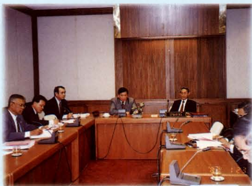
ประชุมรับฟังข้อมูล ข้อเท็จจริงจากส่วนราชการที่มาชี้แจง

ต่อมาที่ประชุมวุฒิสภา ครั้งที่ 4 (สมัยสามัญ ครั้งที่สอง) วันศุกร์ที่ 17 มิถุนายน 2537 ได้ลงมติมอบหมายให้คณะกรรมการสิ่งแวดล้อม วุฒิสภา พิจารณาศึกษาผลกระทบจากการตัดไม้ทำลายป่าที่มีต่อสิ่งแวดล้อม ทรัพยากรธรรมชาติ และคุณภาพชีวิต ภายในระยะเวลา 270 วัน นับแต่วันที่วุฒิสภามอบหมาย และอนุมัติให้คณะกรรมการดำเนินการนอกสมัยประชุมได้ ซึ่งคณะกรรมการฯ จะได้ดำเนินการพิจารณาศึกษาต่อไป