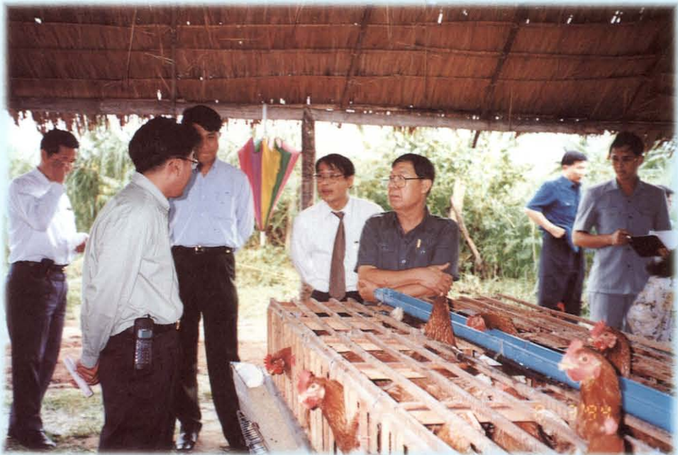
ศึกษาดูงานโครงการไข่ไก่ การส่งเสริมสุกรพันธุ์และตลาดกลางสินค้าเกษตร ระหว่างวันที่ 3-4 สิงหาคม 2537 ณ จังหวัดกำแพงเพชร