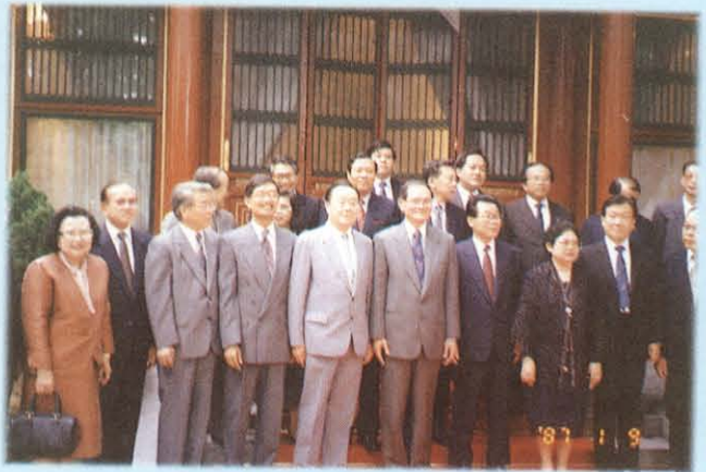
ประธานวุฒิสภา และคณะฯ ร่วมถ่ายภาพกับ ฯพณฯ นายหลี่ รุ่ยหยวน