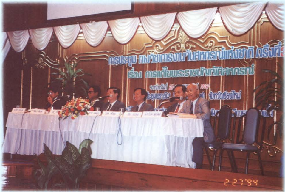
ประชุมทางวิชาการ เรื่องการแก้ พ.ร.บ. สหกรณ์ ระหว่างวันที่ 27-28 กุมภาพันธ์ 2539 ณ จังหวัดเชียงใหม่