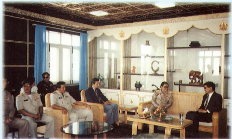
พบรัฐมนตรีว่าการกระทรวงแรงงานและสวัสดิการสังคม ณ สาธารณรัฐประชาธิปไตยประชาชนลาว

หนึ่ง คณะกรรมการฯ ได้ส่งรายงานเรื่องแนวทางในการจัดตั้งกระทรวงแรงงานแล้ว ที่ประชุมวุฒิสภามีมติเห็นชอบด้วยกับรายงานในคราวประชุมวุฒิสภา ครั้งที่ 1 (สมัยสามัญ ครั้งที่หนึ่ง) วันจันทร์ที่ 1 มีนาคม 2536 และส่งรายงานเรื่องการประกันสังคมแล้ว ที่ประชุมวุฒิสภามีมติเห็นชอบด้วยกับรายงาน ในคราวประชุมวุฒิสภา ครั้งที่ 1 (สมัยสามัญ ครั้งที่สอง) วันศุกร์ที่ 7 พฤษภาคม 2536 รวมทั้งได้ส่งรายงาน