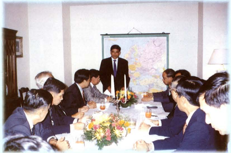
รับฟังการบรรยายสรุป จากเอกอัครราชทูตไทยประจำกรุงปราก ณ ทำเนียบเอกอัครราชทูต สาธารณรัฐเช็ก

ส่วนในเรื่องการพิจารณาศึกษา วิเคราะห์ กฎหมาย ระเบียบ ข้อบังคับ เกี่ยวกับการปกครองนั้น คณะ กรรมการกำลังดำเนินการพิจารณา ศึกษาเพื่อที่จะนำข้อมูล ข้อเท็จจริง และ รายละเอียดที่ได้รับจากภาครัฐและเอกชน มาประกอบการพิจารณาจัดทำรายงาน เสนอต่อวุฒิสภาในโอกาสต่อไป