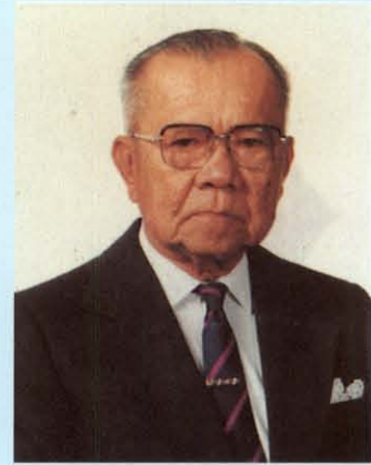
พลอากาศเอก กมล เดชะตุงคะ ประธานคณะกรรมการตรวจรายงานการประชุม และพิจารณาเปิดเผยรายงานการประชุมลับ