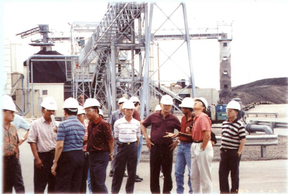
ศึกษาดูงานเกี่ยวกับการนำขยะมาเป็นเชื้อเพลิง ณ TOUR CITY OF COMMERCE MUNICIPAL WASTE, INCINERATOR ประเทศสหรัฐอเมริกา