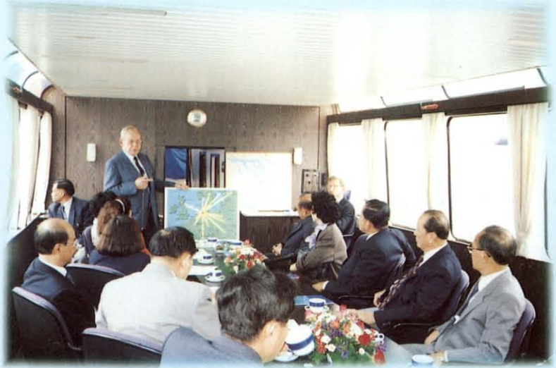
รับฟังบรรยายสรุปและเยี่ยมชมกิจการของท่าเรือฮัมบูร์กสหพันธ์สาธารณรัฐเยอรมัน

11. โครงการอำนวยความสะดวกในด้านการลงทุน โดยเฉพาะการสื่อสารและโทรคมนาคม ควรจะได้มีการศึกษาแผนแม่บท เพื่อรองรับไว้อย่างชัดเจน