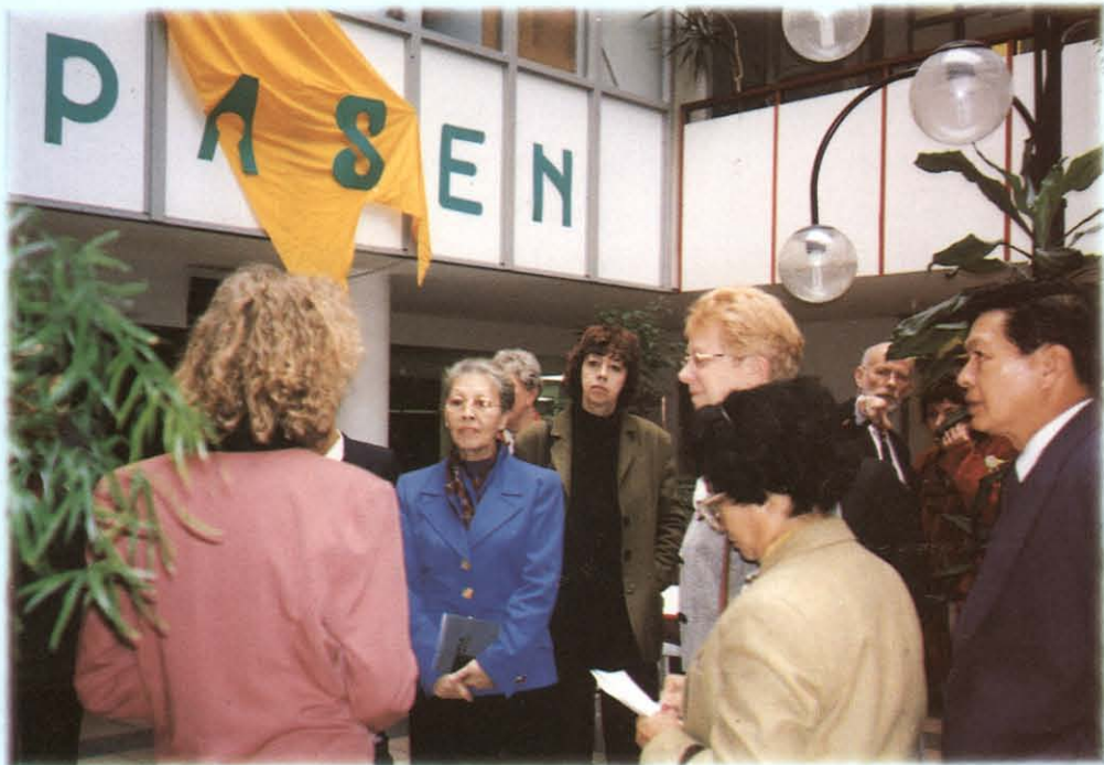
เยี่ยมชมการดำเนินงานของบ้านพักผู้สูงอายุ Dr. Wilhem Dress Huis.