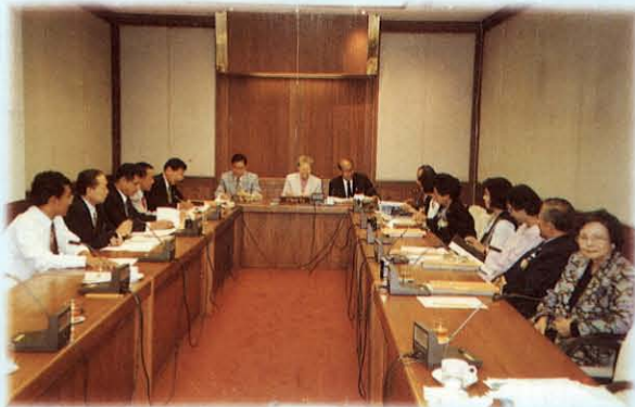
ศึกษาพิจารณาเรื่องคุณภาพเยาวชนที่พึงประสงค์ในสองทศวรรษหน้า ณ ห้องประชุมกรรมการ อาคารรัฐสภา 2

คณะรัฐมนตรีได้มีมติเมื่อวันที่ 24 มกราคม 2538 รับทราบรายงานของคณะกรรมการฯ และมอบให้สำนักงานนายกรัฐมนตรี (สำนักงานปลัดสำนักนายกรัฐมนตรี และสำนักงานคณะกรรมการพัฒนาการเศรษฐกิจและสังคมแห่งชาติ)