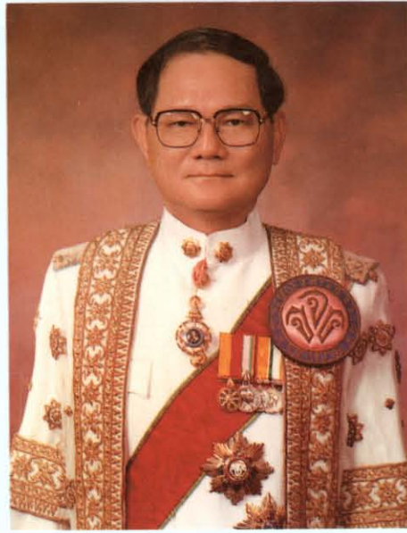
ฯพณฯ นายมีชัย ฤชุพันธุ์ ประธานวุฒิสภา