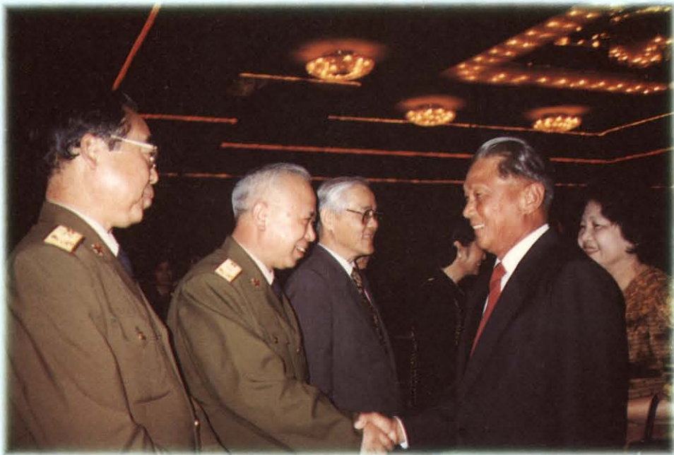
เยี่ยมคารวะรัฐมนตรีว่าการกระทรวงกลาโหม สาธารณรัฐประชาชนจีน