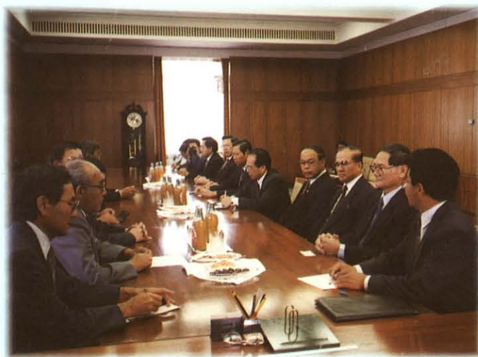
เข้าเยี่ยมคารวะ ฯพณฯ นาย PUNTSAGIIN JASRAI นายกรัฐมนตรี