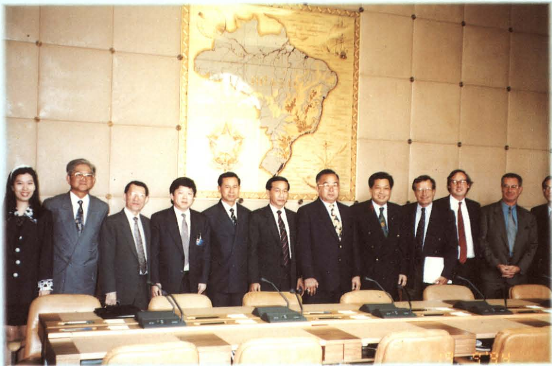
คณะกรรมการฯ พบปะสนทนากับเจ้าหน้าที่ระดับสูงของแกตต์ สมาพันธรัฐสวิส