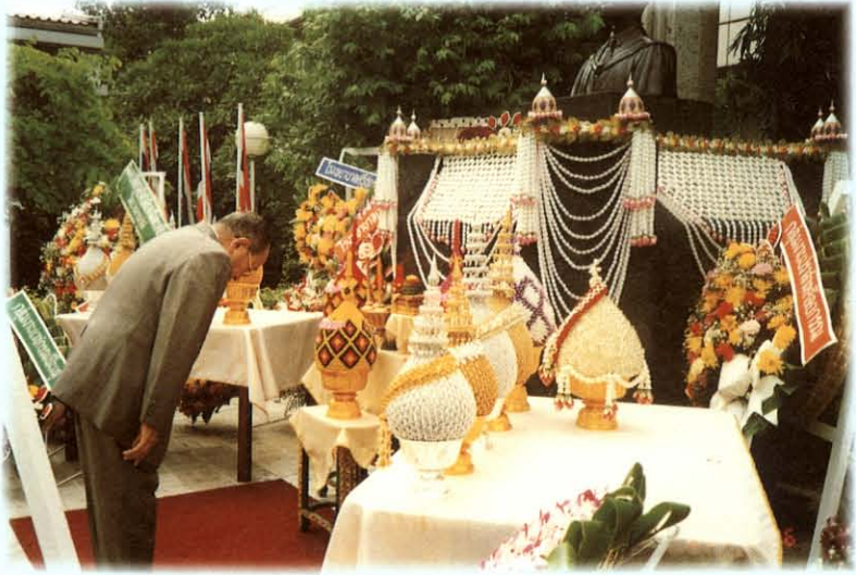
คณะกรรมการฯ ถวายสักการะพระบรมศพสมเด็จพระมหิตลาธิเบศร อดุลยเดชวิกรมพระบรมราชชนก ณ โรงพยาบาลและสถาบันประสาทวิทยา ในวันมหิดล 24 กันยายน 2537

6. คณะทำงานด้านปัญหาการบริการสุขภาพผู้สูงอายุ พิจารณาศึกษาถึงการส่งเสริม และพัฒนางานด้านการให้บริการเรื่องสุขภาพแก่ผู้สูงอายุในประเทศไทยให้ได้มาตรฐานและครอบคลุมมากยิ่งขึ้น โดยศึกษาเปรียบเทียบแนวทางการดำเนินงานกับประเทศที่มีการพัฒนางานทางด้านนี้เป็นอย่างดี