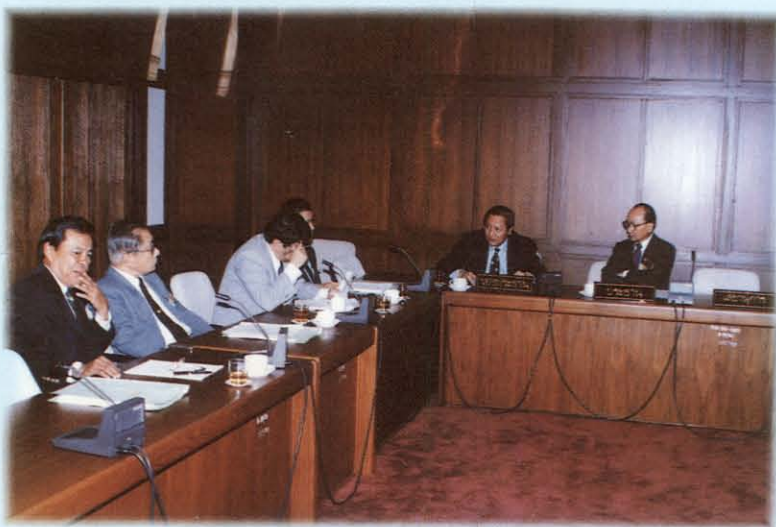
การประชุมคณะกรรมการการเศรษฐกิจและอุตสาหกรรม ประชุมพิจารณาศึกษาญัตติตามที่วุฒิสภามอบหมาย

โดยข้อสังเกตและข้อเสนอแนะของคณะกรรมการเกี่ยวกับ 3 เรื่องดังกล่าวพิจารณาสรุปได้ว่า ในปัจจุบันเศรษฐกิจโลกมีการเปลี่ยนแปลงเข้าสู่เศรษฐกิจแบบการค้าเสรี ดังนั้น ประเทศไทยมีความจำเป็นอย่างยิ่งในการเตรียมพร้อมด้านต่าง ๆ อาทิ การแก้ไขปรับปรุงกฎหมายเก่าแก่ล้าสมัยหรือเป็นอุปสรรคต่อการพัฒนาเศรษฐกิจของประเทศ มาตรการในการเตรียมพร้อมเศรษฐกิจของประเทศไทยสู่ระบบการค้าเสรี ตลอดจนการเร่งรัดและผลักดันการพัฒนาอุตสาหกรรมของประเทศไทย ซึ่งมีการกระจุกตัวอยู่ในกรุงเทพมหานคร ปริมณฑล และจังหวัดใหญ่ ๆ ให้มีการกระจายความ