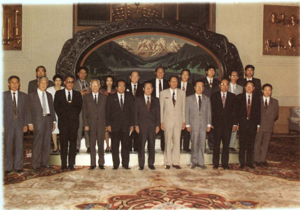
วันที่ 22 กันยายน 2537 เยี่ยมคารวะนายเจียน เทว๋ย ฉิ่ง รองประธานสภาที่ปรึกษาการเมืองแห่งชาติ สาธารณรัฐประชาชนจีน