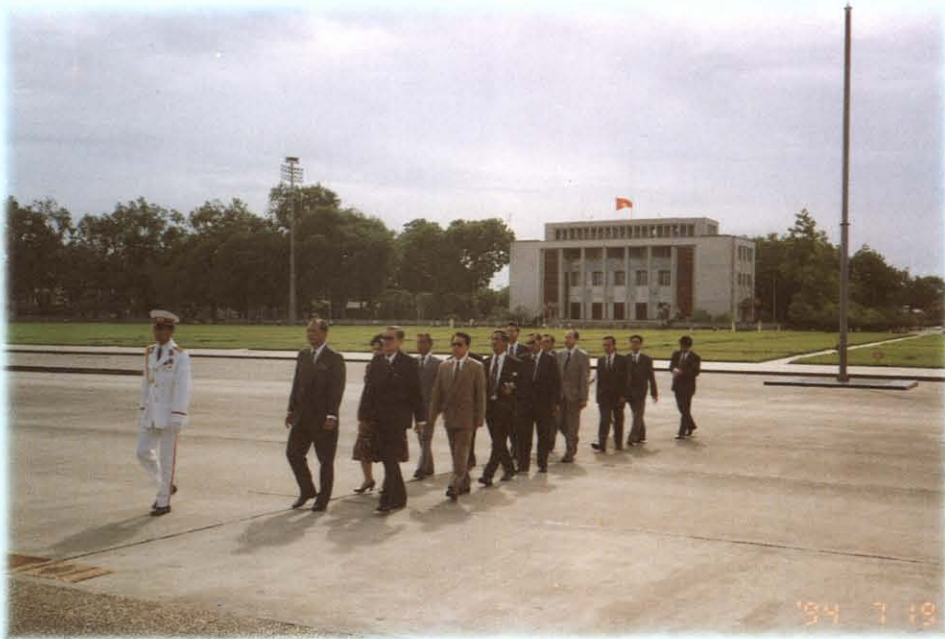
วางพวงมาลา ณอนุสรณ์สถานโฮจิมินห์ เมื่อวันที่ 19 กรกฎาคม 2537