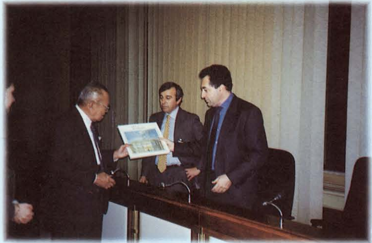
รับฟังการบรรยายสรุป ณ สาธารณรัฐอิตาลี

คณะกรรมการฯ ได้เสนอรายงานการประชุมลับของวุฒิสภาในคราวประชุมวุฒิสภา ครั้งที่ 11 (สมัยสามัญ ครั้งที่หนึ่ง) วันศุกร์ที่ 17 ธันวาคม 2536 ซึ่งคณะกรรมการฯ ได้พิจารณาเสร็จแล้ว เมื่อการประชุมวุฒิสภา ครั้งที่ 4 (สมัยสามัญ ครั้งที่สอง) วันศุกร์ที่ 17 มิถุนายน 2537