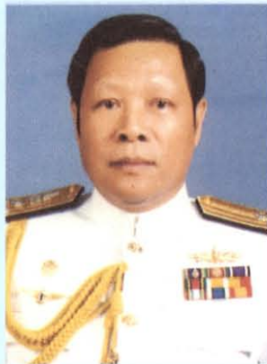
พลเรือเอก เกาหลัก เจริญรุกษ์ ประธานคณะกรรมการการศึกษาและวัฒนธรรม