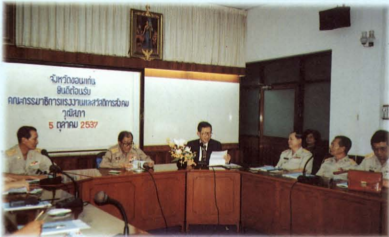
พบรองผู้ว่าราชการจังหวัด รับฟังการบรรยายสรุป ด้านการแรงงานและสวัสดิการสังคม ณ ศาลากลาง จังหวัดขอนแก่น

ข้อสังเกตในสาระสำคัญ ญัตติเรื่องการศึกษาวิเคราะห์กฎหมาย ระเบียบ ข้อบังคับ เกี่ยวกับด้านแรงงานและสวัสดิการสังคม ขณะนี้คณะกรรมการฯ กำลังดำเนินการพิจารณาการศึกษา โดยเน้นการพิจารณากฎหมายในเรื่องต่าง ๆ เช่น ร่างพระราชบัญญัติสวัสดิการสังคมพ.ศ. .... ร่างพระราชบัญญัติแรงงานรัฐวิสาหกิจสัมพันธ์ พ.ศ. .... รวมทั้งการพิจารณาในเรื่องแรงงานประมงและแรงงานต่างด้าวที่เข้ามาทำงานในประเทศไทย