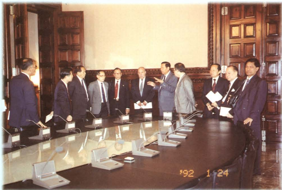
หารือแลกเปลี่ยนความคิดเห็นกับสมาชิกสภาท้องถิ่นของแคว้นกาตาลูญา (บาร์เซโลน่า) ราชอาณาจักรสเปน