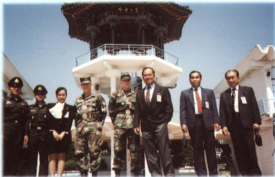
เยี่ยมชมเส้นทางที่ 38 (บ้านมุนจอม)