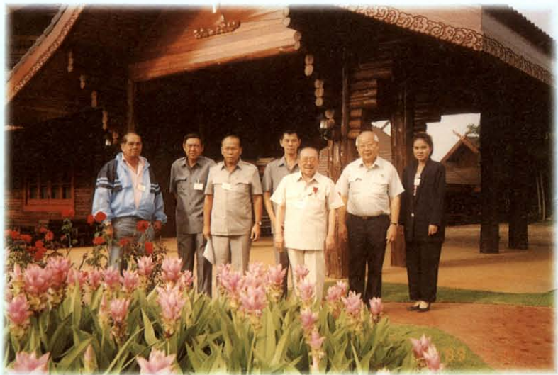
เยี่ยมเชียงใหม่ และดอยตุง ศึกษาข้อมูลที่ศูนย์บำบัดฟื้นฟูผู้ติดยา และปัญหาการแพร่โรคไวรัสสมองอักเสบในหมู่ชาวเขา ระหว่างวันที่ 11-12 กันยายน 2537

ในปี 2537 การพิจารณาศึกษาเกี่ยวกับเรื่องต่าง ๆ ที่ได้รับมอบหมายดังกล่าวข้างต้น คณะกรรมการฯ ได้มีการประชุมพิจารณาศึกษา จำนวน 51 ครั้ง โดยได้รับความร่วมมือจากทั้งภาครัฐและเอกชนที่เกี่ยวข้องมาร่วมประชุมชี้แจง