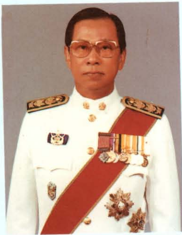
นายอาษา เมฆสวรรค์ รองประธานวุฒิสภา คนที่หนึ่ง