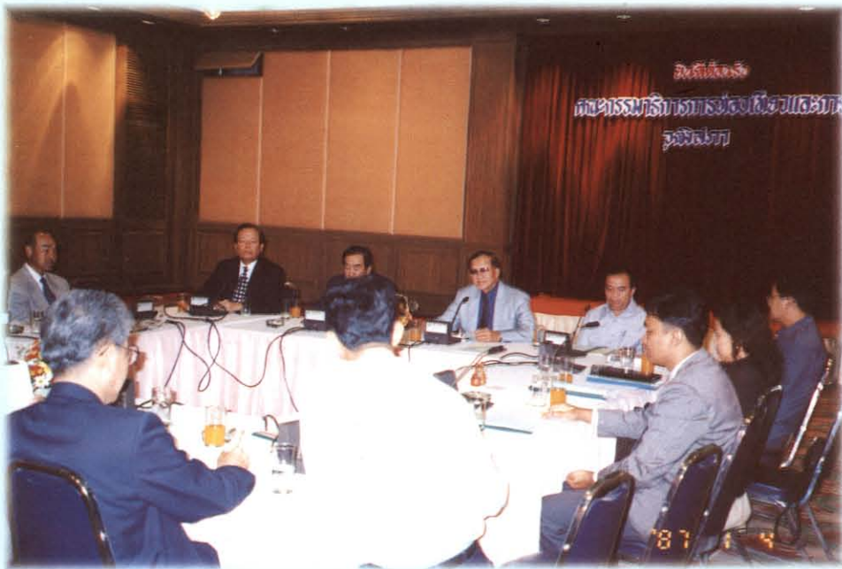
ฟังการบรรยายสรุป ปัญหาด้านการท่องเที่ยว ณ โรงแรมสยามธานี จังหวัดสุราษฎร์ธานี