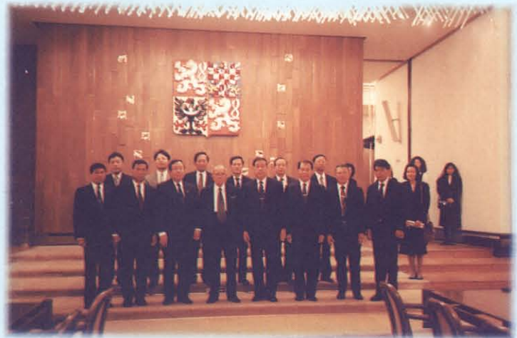
เยี่ยมชมที่ทำการรัฐสภา สาธารณรัฐเช็ก