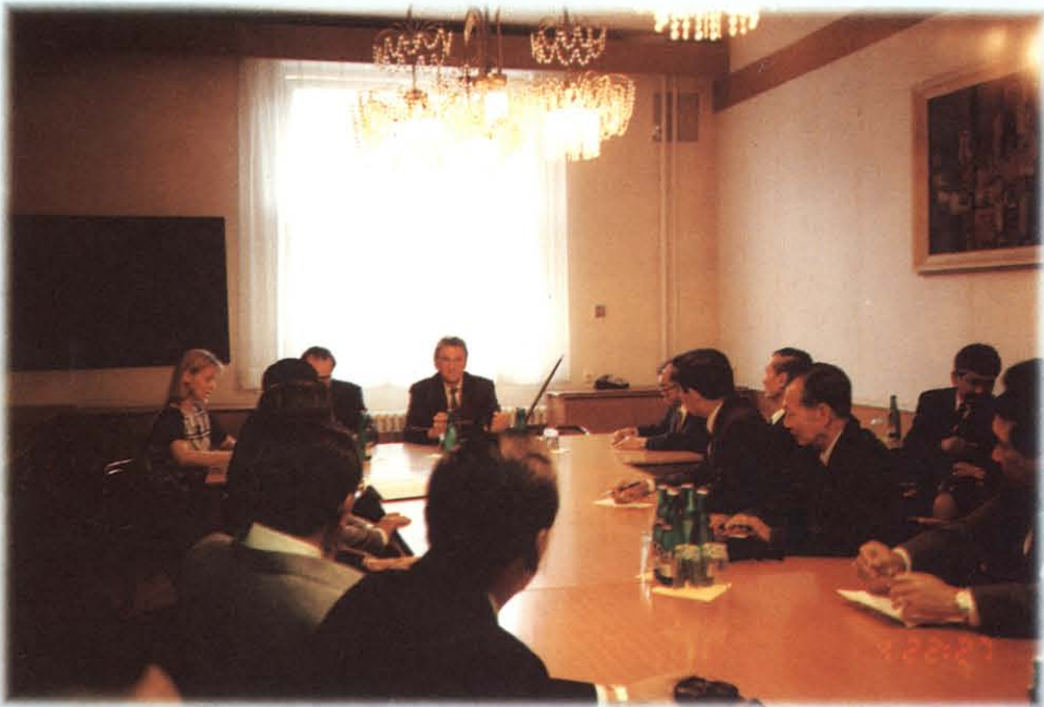
ศึกษาดูงานด้านการแรงงานและสวัสดิการสังคม ณ กระทรวงแรงงานและสวัสดิการสังคม สาธารณรัฐเช็ก