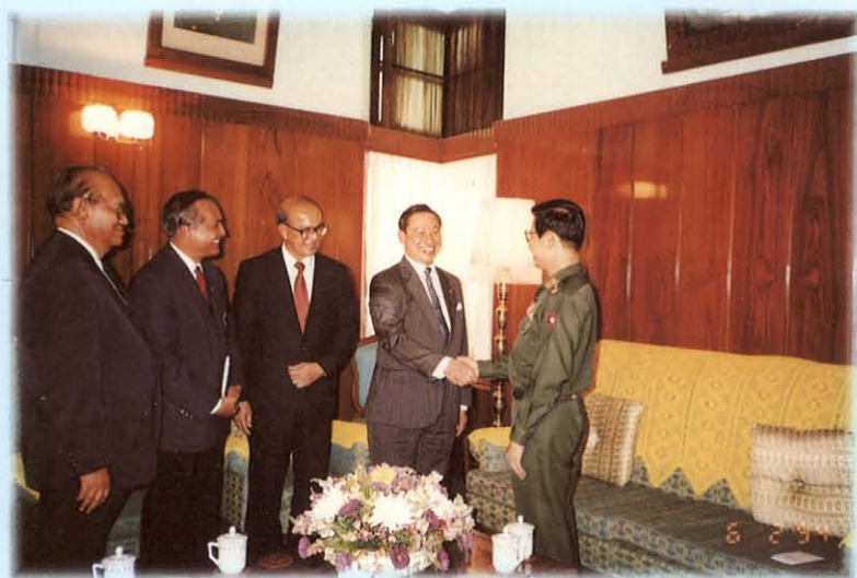
เดินทางไปเยือนและศึกษาดูงาน ณ สหภาพพม่า ระหว่างวันที่ 6-9 กุมภาพันธ์ 2537

คณะกรรมการการต่างประเทศ วุฒิสภา ได้รับมอบหมายจากที่ประชุม วุฒิสภาให้ดำเนินการพิจารณาศึกษาเรื่องเกี่ยวกับความสัมพันธ์ระหว่างประเทศไทยกับนานาชาติ ทั้งในด้านการเมือง เศรษฐกิจ และสังคม รวมทั้งปัญหาชายแดนกับประเทศเพื่อนบ้าน