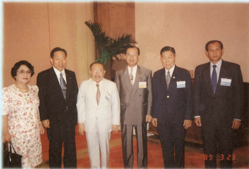
ประธานคณะกรรมการการสาธารณสุข ในฐานะนายกสมาคมมิตรภาพสมาชิกรัฐสภาไทย-ญี่ปุ่น ร่วมประชุมกับฝ่ายญี่ปุ่น เมื่อวันที่ 22 กันยายน 2537 เกี่ยวกับการจัดประชุมด้านสาธารณสุข ที่นครโอซาก้า

2. คณะทำงานด้านปัญหาสิ่งแวดล้อมที่มีผลกระทบต่อสุขภาพ