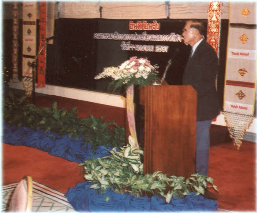
ฟังการบรรยายสรุป ปัญหาด้านการกีฬา ณ ห้องประชุม สนามกีฬาจังหวัดสุราษฎร์ธานี