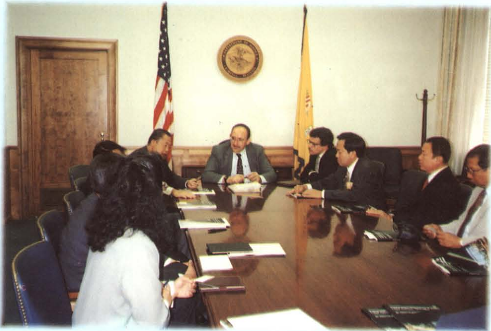
พบปะสนทนาแลกเปลี่ยนความคิดเห็นกับผู้ช่วยอธิบดีกรมอัยการ