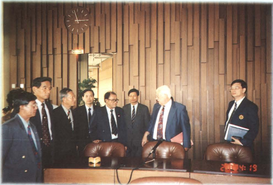
ศึกษาดูงานที่สถาบันแรงงานสัมพันธ์ เมือง NURNBURG สหพันธ์สาธารณรัฐเยอรมัน