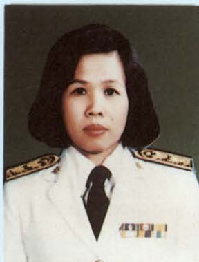
นางสุวิมล ภูมิสิงหาราช รองเลขาธิการวุฒิสภา