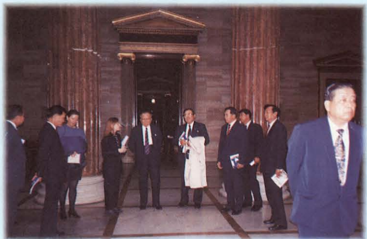
เยี่ยมชมที่ทำการรัฐสภา สาธารณรัฐออสเตรเลีย