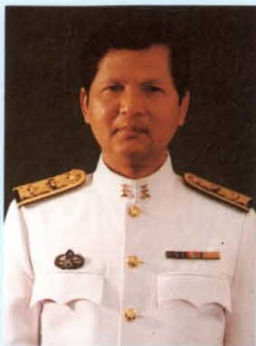
นายจำนงค์ สวมประคำ รองเลขาธิการวุฒิสภา