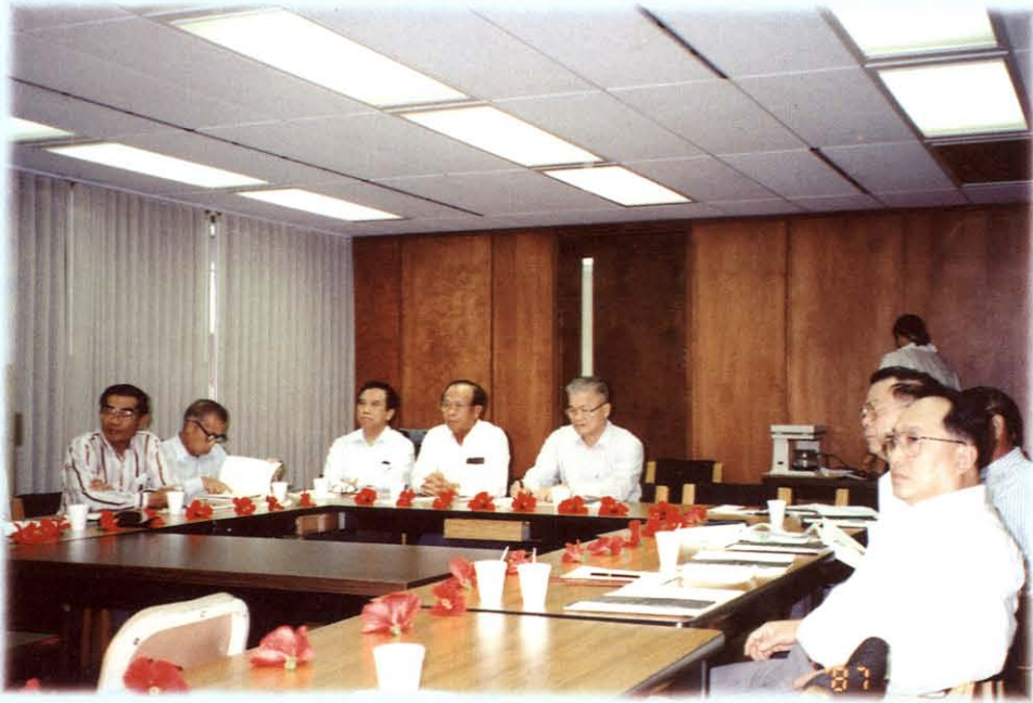
รับฟังการบรรยายเกี่ยวกับนโยบาย ระบบบริหารในการนำพลังงานต่างๆ มาเป็นพลังงานทดแทน ในการผลิตไฟฟ้า ณ EDISON GENERAL ประเทศสหรัฐอเมริกา