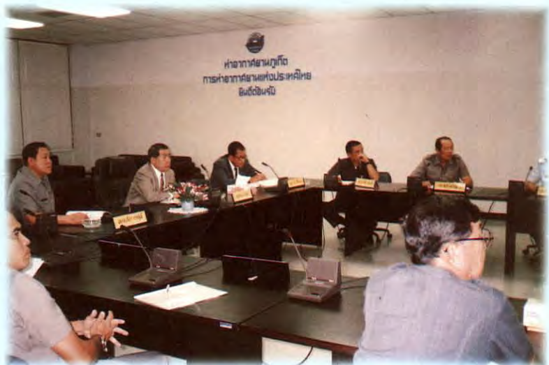
เยี่ยมชมกิจการและการดำเนินงานของท่าอากาศยานภูเก็ต จังหวัดภูเก็ต

7. การกระจายความเจริญด้านการขนส่งทางอากาศไปสู่ภูมิภาคนั้น มีบริษัทเอกชนหลายบริษัทที่ประสงค์จะประกอบการขนส่งทางอากาศ แต่เนื่องจากความไม่ชัดเจน และความไม่ต่อเนื่องของนโยบายรัฐ รวมทั้งการไม่ให้สิทธิทางการบินแก่ผู้ประกอบการ จึงทำให้ไม่มีผู้ประกอบการไปบุกเบิก