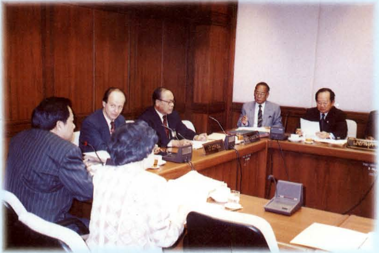
รับฟังการบรรยายสรุป จากเอกอัครราชทูตสาธารณรัฐแอฟริกาใต้ประจำประเทศไทย ณ ห้องประชุมคณะกรรมการหมายเลข 107 อาคารรัฐสภา 2

คณะกรรมการการปกครองได้พิจารณาร่างพระราชบัญญัติทั้ง 6 ฉบับดังกล่าวปรากฏผลการพิจารณาโดยลำดับที่ 1 และ 6 ได้พิจารณาเห็นชอบด้วยกับร่างของสภาผู้แทนราษฎร โดยไม่มีการแก้ไข ซึ่งที่ประชุมวุฒิสภาได้ลงมติเห็นชอบด้วยสำหรับร่างพระราชบัญญัติในลำดับที่ 2 ถึง 5 นั้น คณะกรรมการฯ ได้พิจารณาโดยมีการแก้ไขเพิ่มเติมในบางมาตรา ซึ่งที่ประชุมวุฒิสภาได้ลงมติให้แก้ไขเพิ่มเติมตามที่คณะกรรมการฯ เสนอและส่งให้สภาผู้แทนราษฎรดำเนินการต่อไปตามรัฐธรรมนูญ