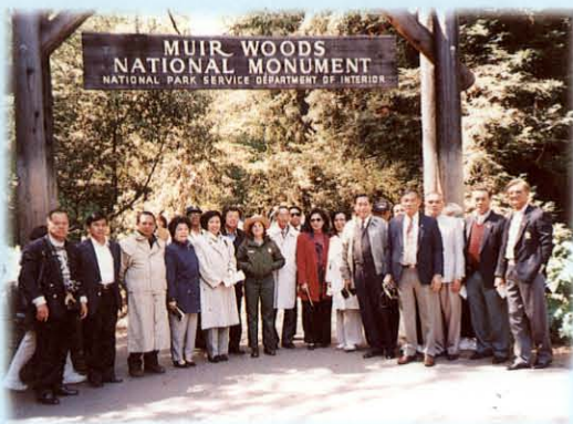
ศึกษาดูงาน เกี่ยวกับการดูแลและอนุรักษ์ป่าไม้ ณ ประเทศสหรัฐอเมริกา และแคนาดา