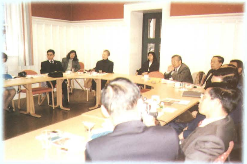
ประชุมปรึกษาหารือและแลกเปลี่ยนความคิดเห็นด้านสวัสดิการผู้สูงอายุ ณ กระทรวงกิจการสังคมและสาธารณสุข ราชอาณาจักรนอร์เวย์

อนึ่ง เรื่องคุณภาพเยาวชนที่พึงประสงค์ในสองทศวรรษหน้า ยังอยู่ในระหว่างการศึกษาพิจารณาของคณะกรรมการฯ ซึ่งจะได้มีการรวบรวมผลการพิจารณาจัดทำเป็นรายงานเสนอต่อที่ประชุมวุฒิสภาต่อไป