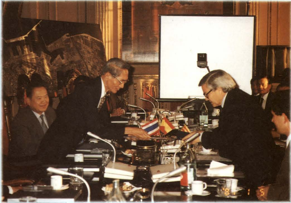
เดินทางไปเยือนและศึกษาดูงานด้านสิ่งแวดล้อม ณ สาธารณรัฐตุรกี ราชอาณาจักรสเปน สาธารณรัฐฝรั่งเศส สาธารณรัฐอิตาลี สาธารณรัฐอียิปต์ ระหว่างวันที่ 20 มกราคม - 2 กุมภาพันธ์ 2537