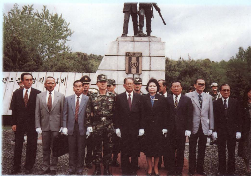
เดินทางไปเยือนและศึกษาดูงานด้านการทหาร ณ สาธารณรัฐเกาหลี และ สาธารณรัฐประชาชนจีน ระหว่างวันที่ 4-13 พฤษภาคม 2537

6. ควรสนับสนุนงบประมาณแก่ฝ่ายทหารในการเตรียมการบรรเทาสาธารณภัย