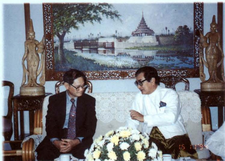
เข้าพบและเยี่ยมคารวะ ฯพณฯ นายอู อองจ้อ รัฐมนตรีว่าการกระทรวงการต่างประเทศของพม่า

นอกจากนี้ ได้มีโอกาสเข้าเยี่ยมชมสถานที่ที่สำคัญทางประวัติศาสตร์และทางพุทธศาสนา ตลอดจนสถานที่ท่องเที่ยวที่น่าสนใจ อาทิ เจดีย์ชเวดากอง ซึ่งเป็นเจดีย์ที่เก่าแก่ที่สุดในโลก เจดีย์ชเวดิกอง (Shwezigon) วัดอานันดา (Ananda Temple) เป็นวัดที่สวยงามที่สุดในเมืองพุกาม พิพิธภัณฑ์ Archaeological Museum เมืองหลวงเก่ามณฑลเจดีย์ชู ตอง ปาย (Su Tuang Pye) ของวัดกุโสดอ เป็นวัดที่เก็บรักษาพระไตรปิฎกที่ใหญ่ที่สุดในโลก เยี่ยมชมโรงงานทอผ้าไหม (Acheik Lunyarygyaw Weaving)