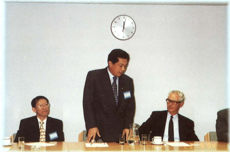
เดินทางไปเยือนและศึกษาดูงานเกี่ยวกับองค์กรเศรษฐกิจภาคเอกชน ณ สมาพันธรัฐสวิส ราชอาณาจักรเบลเยียม สหราชอาณาจักรบริเตนใหญ่และไอร์แลนด์เหนือ

ส่วนใหญ่เรื่องความร่วมมือด้านเศรษฐกิจระหว่างภาครัฐและภาคเอกชนนั้น คณะกรรมการกำลังดำเนินการพิจารณา ศึกษาโดยในเบื้องต้นได้ข้อมูล ข้อเท็จจริง จากทั้งภาครัฐและภาคเอกชน รวมทั้งได้เดินทางไปเยือนและศึกษาดูงาน ณ สมาพันธรัฐสวิส ราชอาณาจักรเบลเยียม และสหราชอาณาจักรบริเตนใหญ่ และไอร์แลนด์เหนือ ระหว่างวันที่ 18-26 กันยายน 2537 เพื่อนำข้อมูล ข้อเท็จจริง และรายละเอียดมาประกอบการพิจารณาจัดทำรายงานเสนอต่อที่ประชุมวุฒิสภาในโอกาสต่อไป