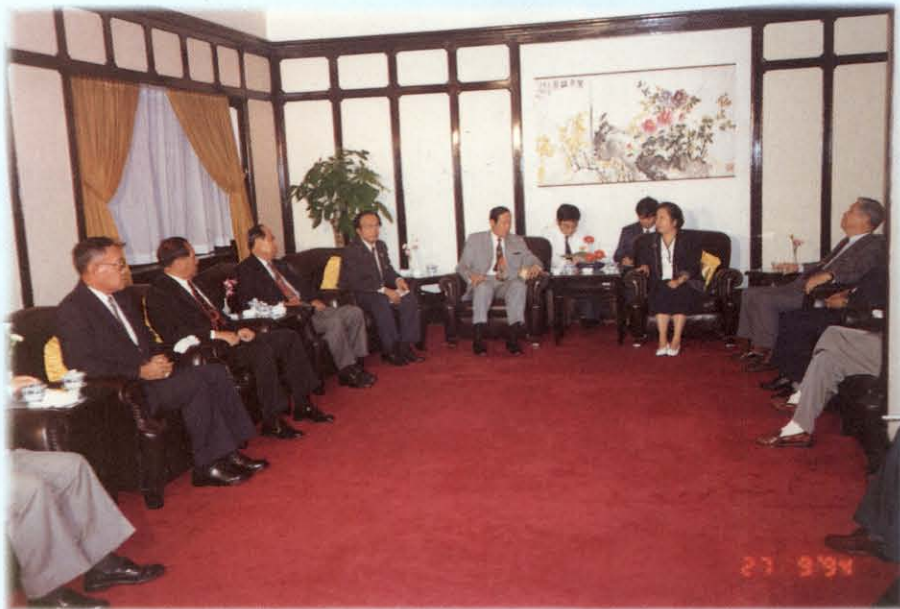
เดินทางไปเยือนสาธารณรัฐประชาชนจีนอย่างเป็นทางการเพื่อกระชับสัมพันธ์ภาพอันดีระหว่างกัน ระหว่างวันที่ 22-29 กันยายน 2537