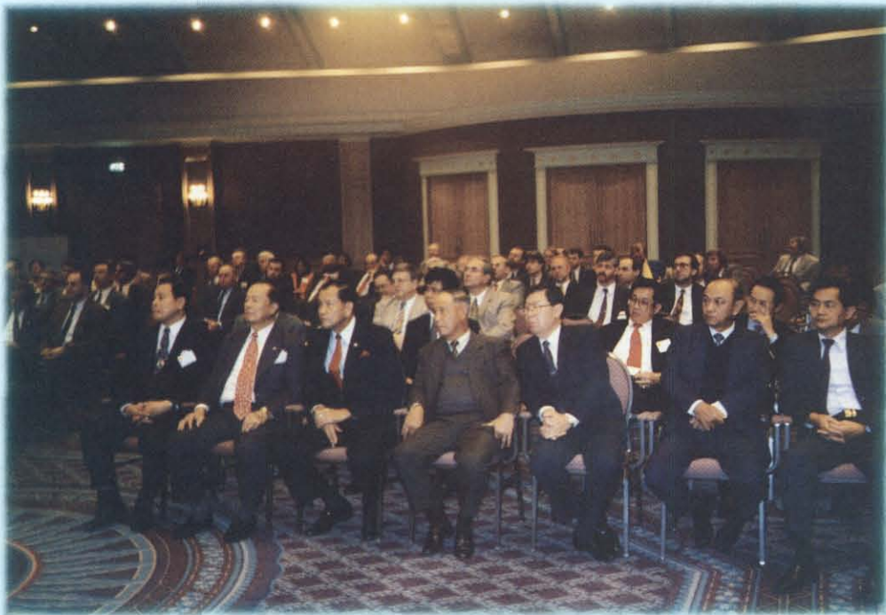
ร่วมพิธีเปิดงาน "THAI HABOUR DAYS" ณ เมืองแอนท์เวิร์ป/ราชอาณาจักรเบลเยียม