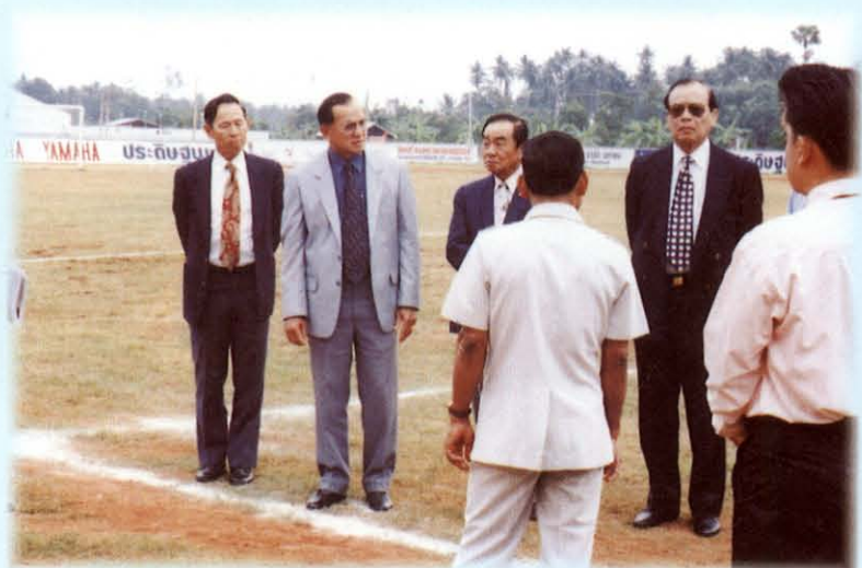
ศึกษาดูงานด้านการศึกษา ณ สนามกีฬาจังหวัดสุราษฎร์ธานี

ส่วนในญัตติที่เกี่ยวกับแนวทางการพัฒนากีฬาของชาติ คณะกรรมการฯ ได้พิจารณาและให้ความสนใจกับทั้ง 4 ประเด็นที่กล่าวมา โดยเฉพาะอย่างยิ่งในประเด็นการส่งเสริมการกีฬา การพัฒนามาตรฐานการกีฬาเพื่อให้ทัดเทียมกับนานาประเทศ ทั้งนี้ คณะกรรมการฯ ศึกษาปัญหาอุปสรรค ข้อมูลต่าง ๆ ในการแข่งขันระดับนานาชาติที่ผ่านมา เพื่อหาแนวทางการพัฒนาการกีฬาของชาติไทยให้มีความสามารถทัดเทียมกับนานาประเทศ โดยการใช้วิทยาศาสตร์และเทคโนโลยีในการพัฒนานักกีฬาไทยให้มีความสามารถ และได้มาซึ่งความเป็นเลิศในกีฬาระดับนานาชาติ และเพื่อหาแนวทางการสนับสนุนจากรัฐบาล และองค์กรเอกชน ทั้งในส่วนที่เกี่ยวข้องโดยตรงด้านกีฬาและอื่น ๆ เพื่อให้ได้มาซึ่งงบประมาณดำเนินการพัฒนาการกีฬาให้บรรลุเป้าหมายสู่ความเป็นเลิศ ในการแข่งขันกีฬาซีเกมส์ กีฬาโอลิมปิกที่แอตแลนต้า และเอเชียนเกมส์ที่กรุงเทพฯ พ.ศ. 2541 ต่อไป