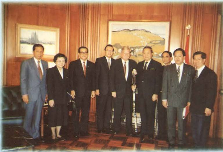
เข้าเยี่ยมคารวะและสนทนาแลกเปลี่ยนความคิดเห็นกับประธานศาลฎีกาของแคนาดา

ส่วนการพิจารณาเรื่องพัฒนาการขององค์กรหรือหน่วยงานต่าง ๆ ที่เกี่ยวข้องกับกระบวนการยุติธรรมทางอาญาและทางแพ่งนั้น คณะกรรมการฯ กำลังดำเนินการพิจารณาศึกษาเกี่ยวกับโครงสร้างวิธีการดำเนินการบทบาทอำนาจหน้าที่ ตลอดจนแนวทางในการพัฒนากระบวนการยุติธรรมทั้งระบบ โดยจะได้มีการรวบรวมข้อมูล ข้อเท็จจริงและรายละเอียดที่ได้รับจากการฟังคำชี้แจง และจากเอกสารที่ได้รับจากภาครัฐและเอกชน มาสรุปวิเคราะห์ และจัดสัมมนา โดยจะได้จัดทำรายงานเสนอต่อวุฒิสภาพิจารณาในโอกาสต่อไป