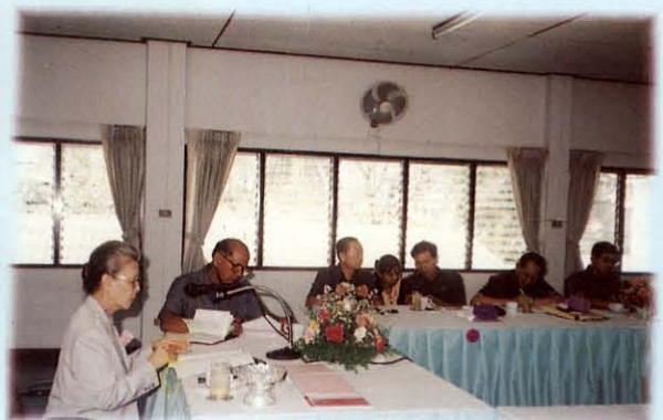
ฟังการบรรยายสรุป ณ สถานสงเคราะห์คนชรา จังหวัดนครราชสีมา