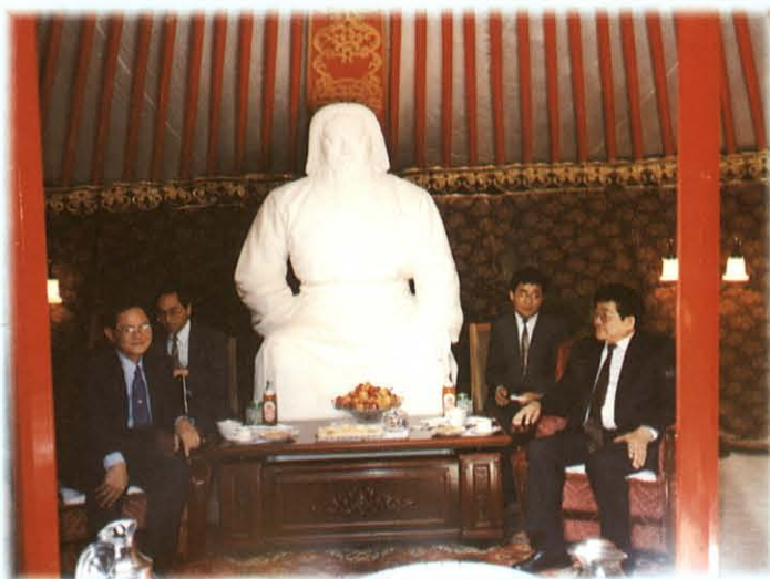
เข้าพบและสนทนาแลกเปลี่ยนความคิดเห็นกับ ฯพณฯ นาย PUNSALIMAAGIIN OCHIRBAT ประธานาธิบดี

ของชาวมองโกเลียดั้งเดิมที่อาศัยอยู่ในกระท่อมของจังหวัดโตฟ (Tov) เยี่ยมชมโรงงานผลิตภัณฑ์ขนสัตว์ที่ใหญ่ที่สุดของมองโกเลีย (Cashmere Factory "GOBI") เยี่ยมชมสมาคมมิตรภาพมองโกเลีย-ไทย (The Mogolia-Thai Friendship Society)