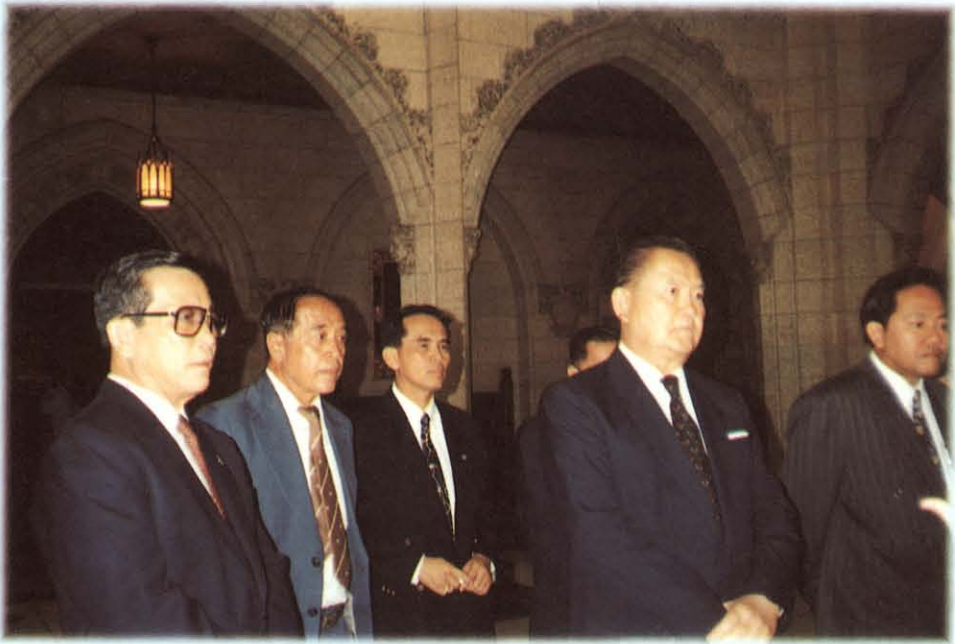
เยี่ยมชมรัฐสภา แคนาดา เมื่อวันที่ 13 กรกฎาคม 2537