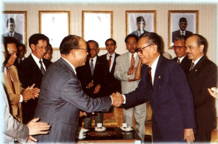
เยี่ยมคารวะประธานรัฐสภา สาธารณรัฐอินโดนีเซีย

เดินทางไปเยือนและศึกษาดูงาน ณ สาธารณรัฐ อินโดนีเซีย ระหว่างวันที่ 25-29 มกราคม 2537