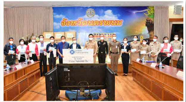
และสำนักงานพัฒนาสังคมและความมั่นคงของมนุษย์จังหวัด นครพนม เป็นผู้รับมอบ