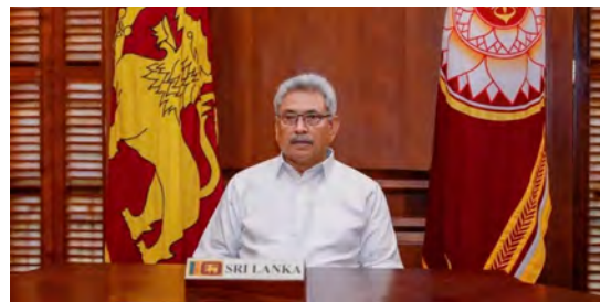
ประธานาธิบดีโคธธากะราชปักษะ

วันที่ ๑๒ พฤษภาคม ๒๕๖๕ ประธานาธิบดีโคธธากะราชปักษะ แห่งศรีลังกา จะแต่งตั้งนายกรัฐมนตรีคนใหม่ โดยคัดเลือกจากผู้ที่มีความไว้วางใจจากสมาชิกรัฐสภา ขณะเดียวกันประธานาธิบดีราชปักษะยังระบุว่า จะเดินหน้าแก้ไขรัฐธรรมนูญซึ่งเป็นการเพิ่มอำนาจให้กับบทบัญญัติในรัฐธรรมนูญฉบับที่ ๑๙ ทั้งนี้ รัฐธรรมนูญฉบับที่ ๑๙ ซึ่งจำกัดอำนาจของประธานาธิบดีเอาไว้แล้วนั้น ได้ถูกแทนที่ด้วยรัฐธรรมนูญฉบับที่ ๒๐ ในปี ๒๕๖๓ ซึ่งให้อำนาจ