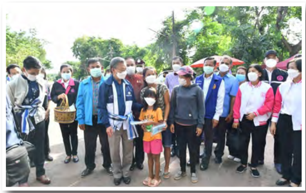
ซึ่งเป็น ๓ จังหวัดสุดท้ายที่นายชวน หลีกภัย จะลงพื้นที่ครบ ทั้ง ๗๖ จังหวัดทั่วประเทศ ภายในเดือนมิถุนายน ๒๕๖๕