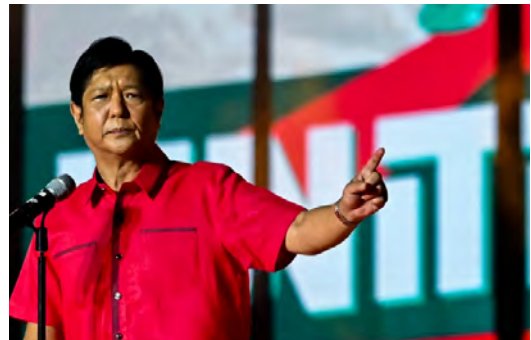
เฟร์ดินานด์ มาร์กอส จูเนียร์

ผู้เป็นบิดา ทั้งนี้ บองบองประกาศนโยบายชัดเจนในระหว่างหาเสียง คือ การสร้างความปรองดองและเป็นหนึ่งเดียวกันของชาวฟิลิปปินส์ แม้นักวิเคราะห์ทางการเมืองจะชี้ว่าการรับตำแหน่งประธานาธิบดีของบองบอง อาจไม่ส่งเสริมความเป็นไปได้ในเรื่องนี้ เนื่องจากยังมีนักการเมืองและประชาชนไม่น้อยที่ต่อต้านและไม่ชื่นชมในอิทธิพลทางการเมืองและความมั่งคั่งของตระกูลมาร์กอส