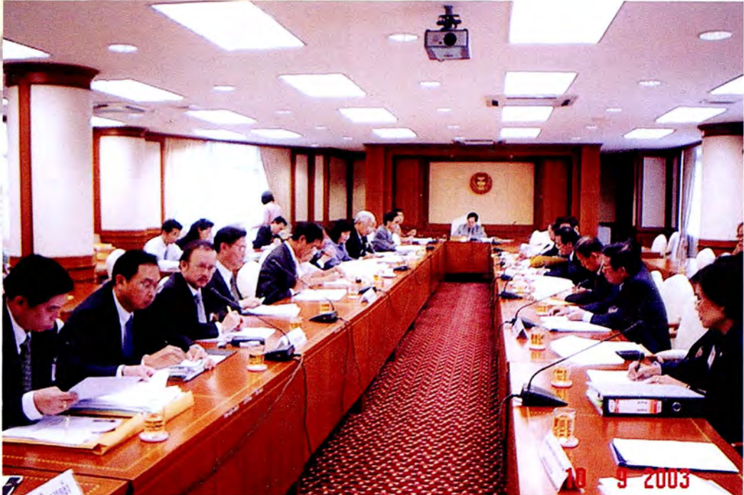
การประชุมคณะกรรมการการเงิน การคลัง การธนาคารและสถาบันการเงิน