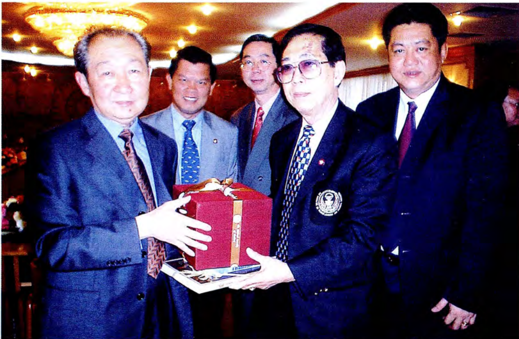
ประธานคณะกรรมการมอบของที่ระลึกให้คณะกรรมการการคลังและเศรษฐกิจมณฑลยูนนาน ในโอกาสศึกษาดูงาน ณ สาธารณรัฐประชาชนจีน