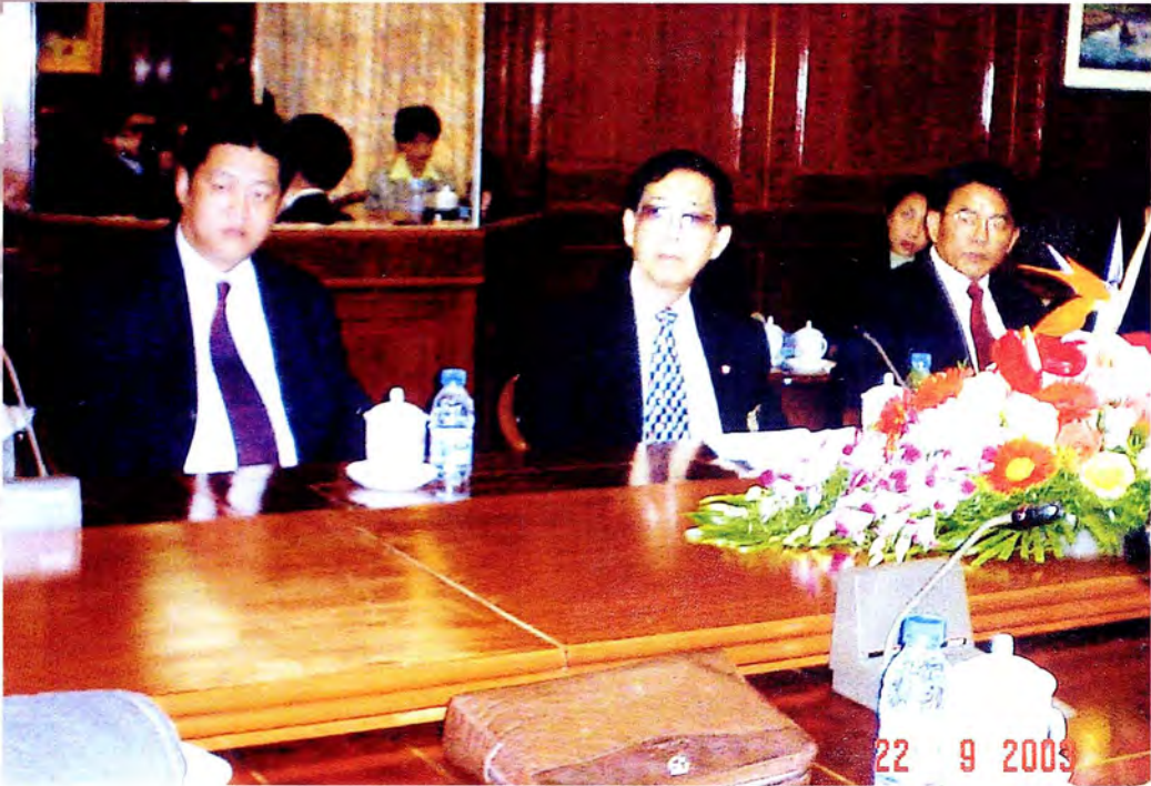
คณะกรรมการรับฟังการบรรยายสรุปภาวะการเงิน การคลัง การธนาคารและสถาบันการเงิน ณ ธนาคารชาติสาธารณรัฐประชาชนจีน สาขามณฑลยูนนาน