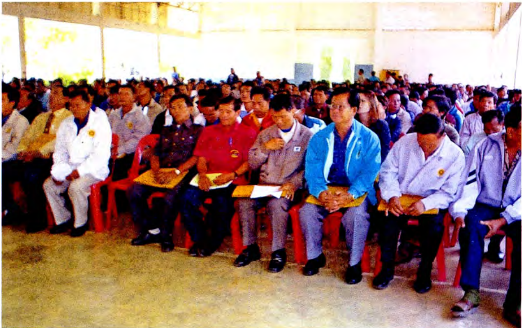
ผู้เข้าร่วมการสัมมนาจังหวัดอุดรธานี

ประธานดำเนินการจัดการสัมมนาทางวิชาการ กล่าวรายงานวัตถุประสงค์การจัดการสัมมนาทาง วิชาการของคณะกรรมการธิการ ณ จังหวัดอุดรธานี