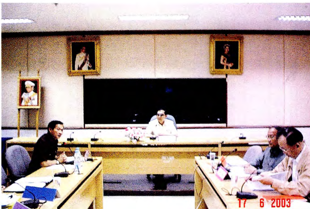
คณะกรรมการรับฟังการบรรยายสรุปภาวะเศรษฐกิจ ในโอกาสเดินทางไปศึกษาดูงาน ณ จังหวัดหนองคาย