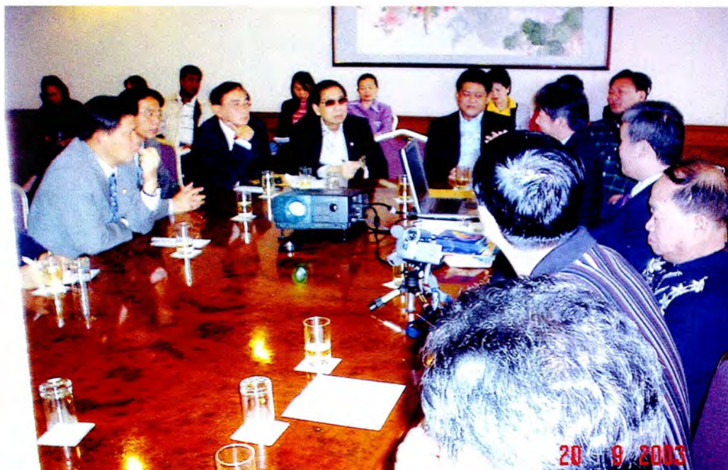
คณะกรรมการซักถามประเด็นปัญหากับผู้จัดการธนาคารกรุงไทย จำกัด สาขานครชุมนหมิง ในโอกาสคณะกรรมการศึกษาดูงาน ณ มณฑลยูนนาน สาธารณรัฐประชาชนจีน

รัฐบาลไทย คณะมนตรีเศรษฐกิจและสังคมแห่งชาติ กรมส่งเสริมการค้าระหว่างประเทศ กระทรวงพาณิชย์ กรมส่งเสริมการค้าระหว่างประเทศ กรมส่งเสริมการค้าระหว่างประเทศ