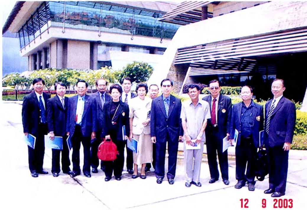
คณะกรรมการการศึกษาดูงาน ณ ธนาคารแห่งประเทศไทย สำนักงานภาคเหนือ จังหวัดเชียงใหม่