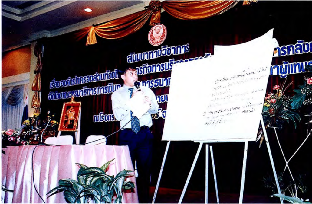
ผู้เข้าร่วมการสัมมนาร่วมเสนอประเด็นปัญหาของการบริหารจัดการการเงิน การคลังท้องถิ่น ในโอกาสที่คณะกรรมการการเงิน การคลังฯ จัดการสัมมนาทางวิชาการ ณ จังหวัดพระนครศรีอยุธยา