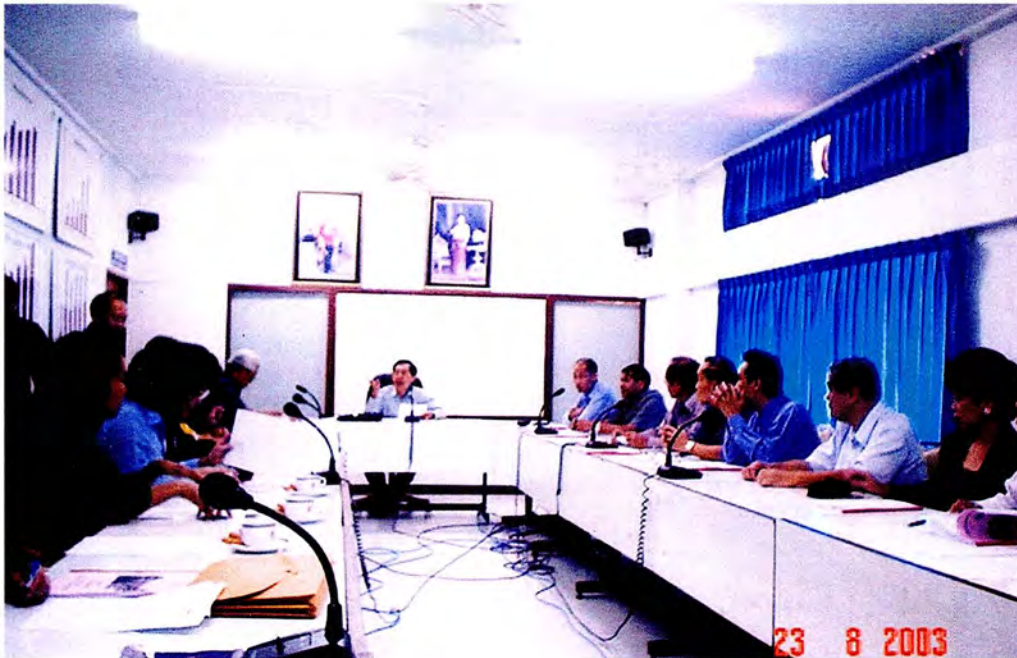
คณะกรรมการรับฟังการบรรยายสรุปและซักถามข้อสงสัย ระหว่างการศึกษาดูงาน ณ จังหวัดสงขลา