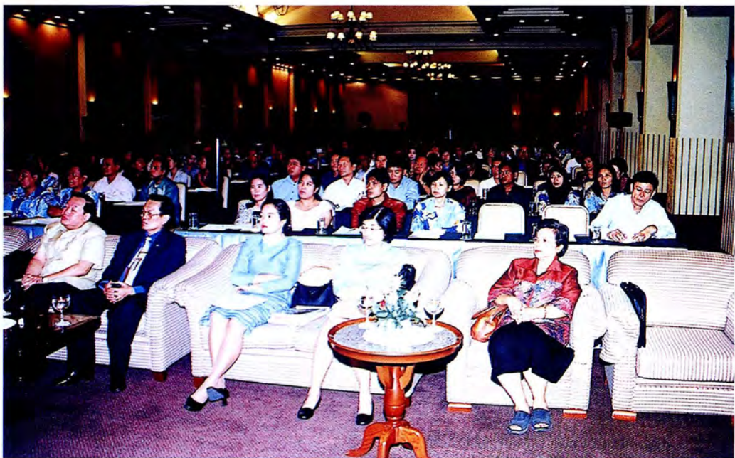
บรรยากาศโดยทั่วไปในห้องประชุมที่ใช้จัดการสัมมนา จังหวัดพระนครศรีอยุธยา