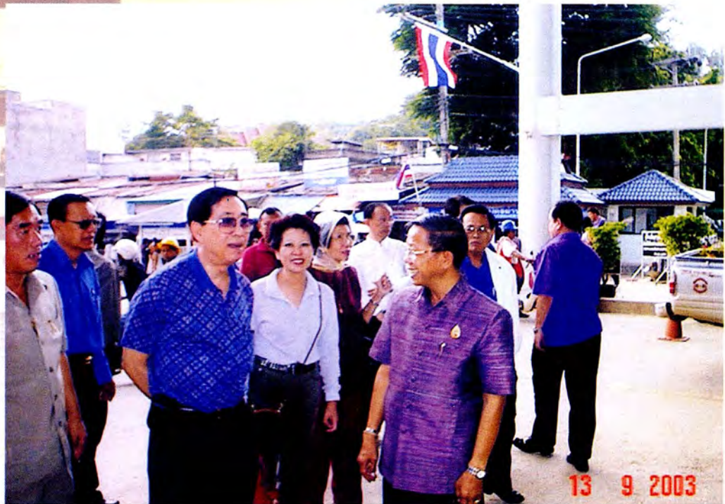
คณะกรรมการศึกษาดูงาน ณ ด้านบุคลากรแม่สาย จังหวัดเชียงราย