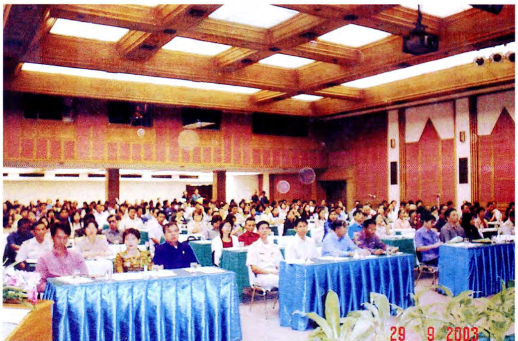
บรรยากาศทั่วไปของการสัมมนาทางวิชาการของคณะกรรมการการ ฌ จังหวัดนครสวรรค์ ที่มีผู้เข้าร่วมการสัมมนาอย่างคับคั่งเกินเป้าหมายที่ตั้งไว้