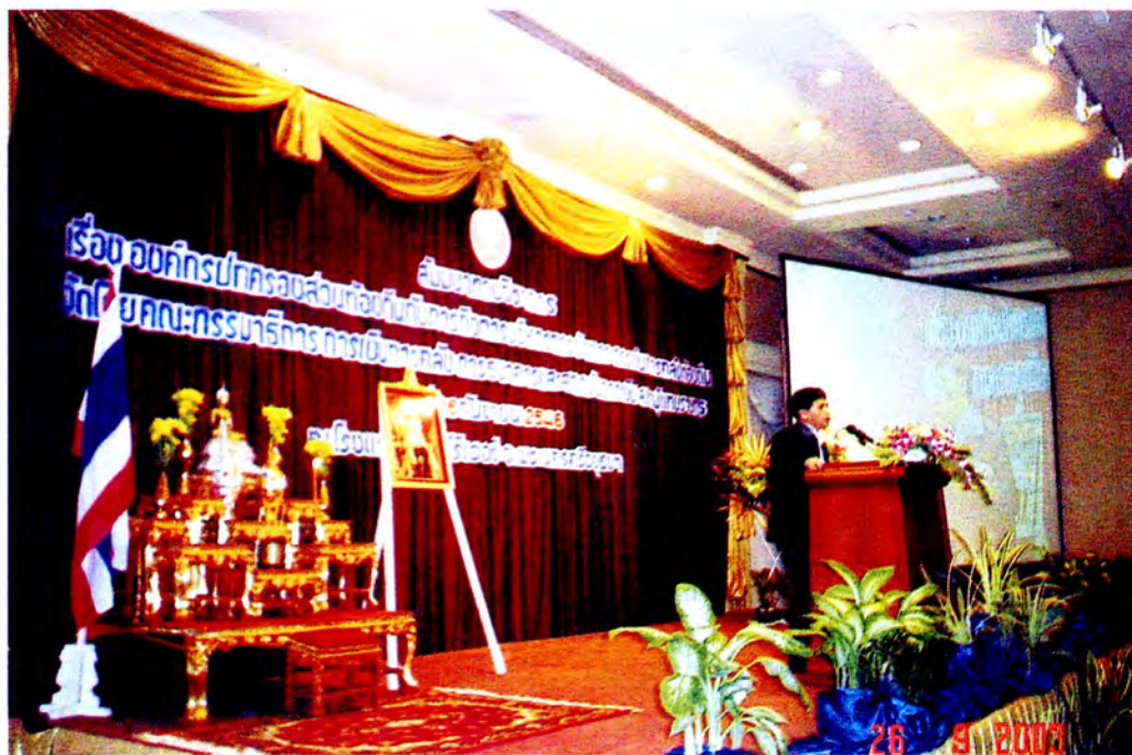
นายสมศักดิ์ ปริศนานันทกุล รองประธานสภาผู้แทนราษฎร คนที่หนึ่ง เป็นประธานในพิธีเปิดการสัมมนาทางวิชาการของคณะกรรมการ ณ จังหวัดพระนครศรีอยุธยา

บันทึกข้อความ วันที่ ๒๖ กันยายน ๒๕๕๑ เรื่อง อนุมัติการดำเนินงาน