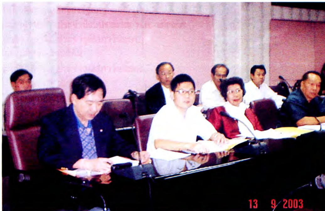
คณะกรรมการรับฟังการบรรยายสรุปการค้าชายแดนไทย-พม่า ณ ด้านศุลกากรแม่สาย จังหวัดเชียงราย