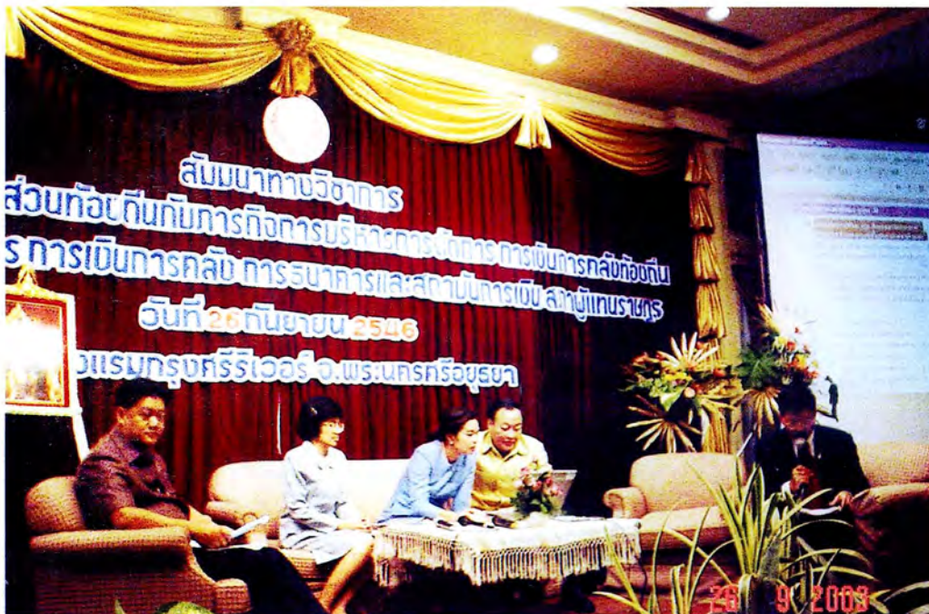
คณะวิทยากรบรรยายให้ความรู้ในโอกาสการสัมมนาทางวิชาการ ของคณะกรรมการการเงิน การคลังฯ จังหวัดพระนครศรีอยุธยา