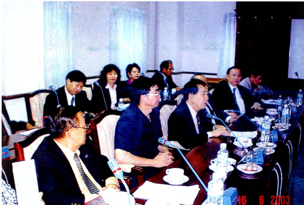
คณะกรรมการรับฟังการบรรยายสรุปภาวะเศรษฐกิจการเงิน การคลัง ในโอกาสเดินทางไปศึกษาดูงาน ณ สาธารณรัฐประชาธิปไตยประชาชนลาว