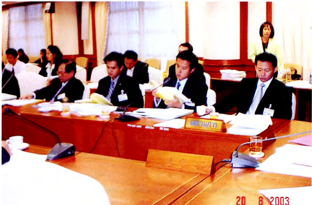
กรรมการพิจารณาศึกษาเอกสารในระหว่างการประชุมคณะกรรมการ