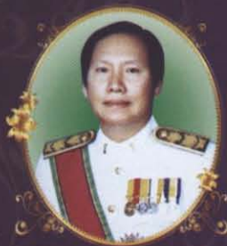
นายไพศาล วิเชียรเกื้อ อธิบดีกรมพินิจและคุ้มครองเด็ก และเยาวชน