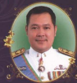
พันตำรวจเอก ทวี สอดส่อง อธิบดีกรมสอบสวนคดีพิเศษ