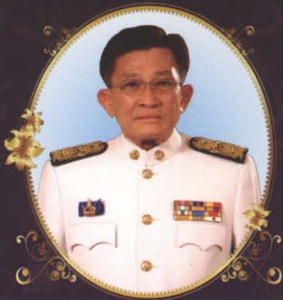
นายสมพงษ์ อมรวิวัฒน์

รัฐมนตรีว่าการกระทรวงยุติธรรม (1 ตุลาคม 2550 - มีนาคม 2551)