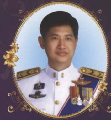
นายชาญเชาวน์ ไชยานุกิจ รองปลัดกระทรวงยุติธรรม หัวหน้ากลุ่มภารกิจ ด้านอำนวยความยุติธรรม