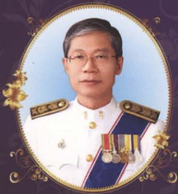
นายพิษณุโรจน์ พลับรูการ รองปลัดกระทรวงยุติธรรม