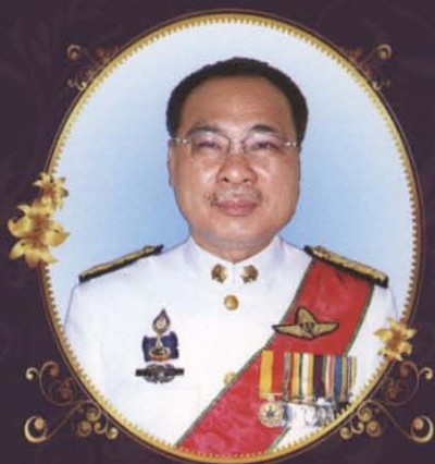
นายสมศักดิ์ เทียมติสุรนนท์

รัฐมนตรีว่าการกระทรวงยุติธรรม (1 ตุลาคม 2550 - มีนาคม 2551)