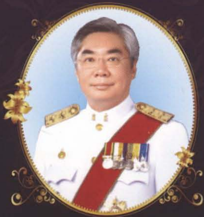
นายกิตติพงษ์ กิตยารักษ์

รัฐมนตรีว่าการกระทรวงยุติธรรม (1 เมษายน 2551 - 15 ธันวาคม 2551)