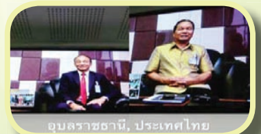
อุบลราชธานี, ประเทศไทย

วันอังคารที่ ๒๒ ตุลาคม ๒๕๕๖ ณ ห้องประชุมสำนักงานรัฐสภาอุบลราชธานี สำนักงานรัฐสภาอุบลราชธานี ร่วมกับ คณะรัฐศาสตร์ มหาวิทยาลัยอุบลราชธานี จัดอบรมสัมมนา “โครงการยุวชนรัฐศาสตร์ สู่เส้นทางประชาธิปไตย” เพื่อให้มีความรู้ความเข้าใจเกี่ยวกับ ความเป็นพลเมืองในระบบประชาธิปไตย และประชาธิปไตยกับการมีส่วนร่วม