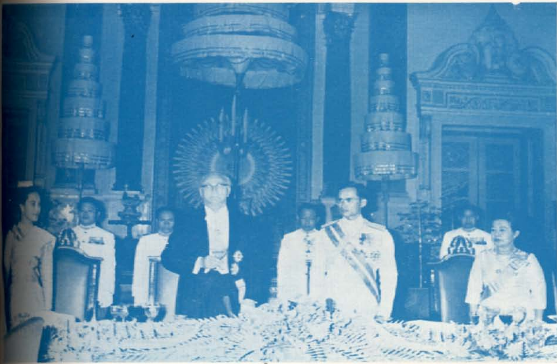
พระราชทานเลี้ยงอาหารค่ำเป็นเกียรติแด่ ฯพณฯ ประธานาธิบดี ณ พระที่นั่งจักรมหาปราสาท ๑๘ มกราคม ๒๕๑๐