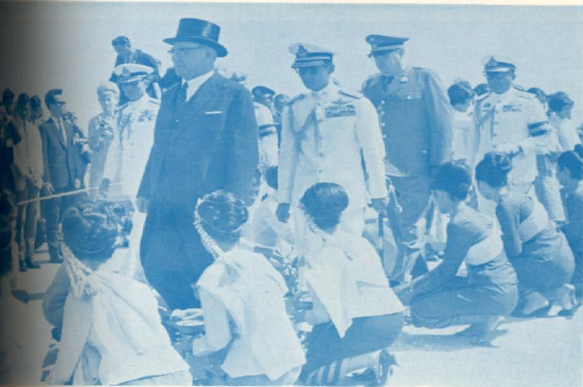
มหาสมเด็จพระเจ้าอยู่หัว เสด็จพระราชดำเนินยังท่าอากาศยานดอนเมือง ทรงต้อนรับ ฯพณฯ ฟรานซ์ โยนาส ประธานาธิบดีแห่งสาธารณรัฐ ออสเตรีย ซึ่งมาเยือนประเทศไทยเป็นทางราชการ