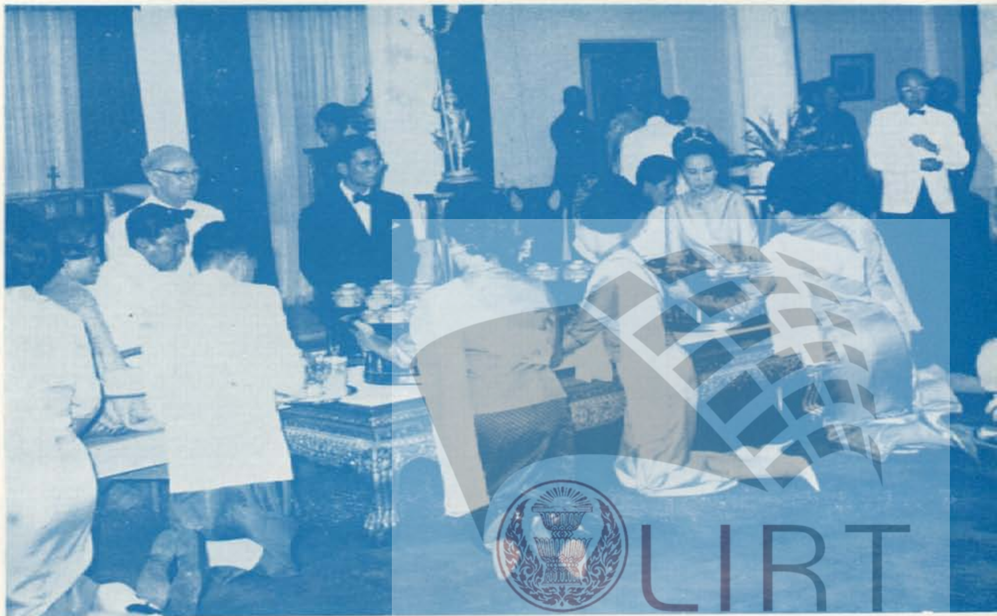
พระราชทานเลี้ยงอาหารแบบพบนเมือง ณ พระตำหนักภูพิงคราชนิเวศน์ จังหวัดเชียงใหม่ ๒๑ มกราคม ๒๕๑๐