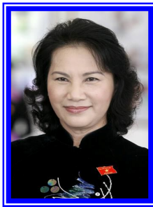
Mrs. Nguyen Thi Kim Ngan ๒ ประธานสภาแห่งชาติ

ในส่วนของรองประธานสภาแห่งชาตินั้นมีหน้าที่ช่วยปฏิบัติภารกิจของประธานสภาแห่งชาติให้สำเร็จลุล่วงตามที่ได้รับภารกิจจากประธานสภาแห่งชาติ