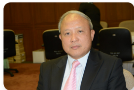
พล.ต.ท. บุญเรือง ผลพานิชย์ ลำดับที่ ๐๗๘