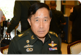
พล.อ. ฉัตรเฉลิม เฉลิมสุข ลำดับที่ ๐๒๕