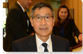
พล.อ.อ. ตรีทศ สนแจ้ง ลำดับที่ ๐๔๕