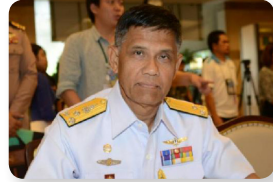
พล.ร.ท. วีระพันธ์ สุขก้อน ลำดับที่ ๑๒๙