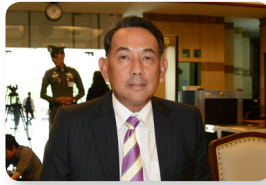
พล.อ.อ. ศิวเกียรติ์ ชยามะ ลำดับที่ ๑๔๐