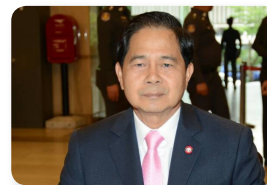
พล.อ. รัชสาทยั แซ่มะเชื้อ ลำดับที่ ๒๐๙