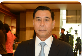
พล.อ. คณิต สาทัทภักษ์ ลำดับที่ ๐๑๖