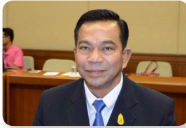
พล.ต. ณัฐ อินทรเจริญ ลำดับที่ ๑๙๑