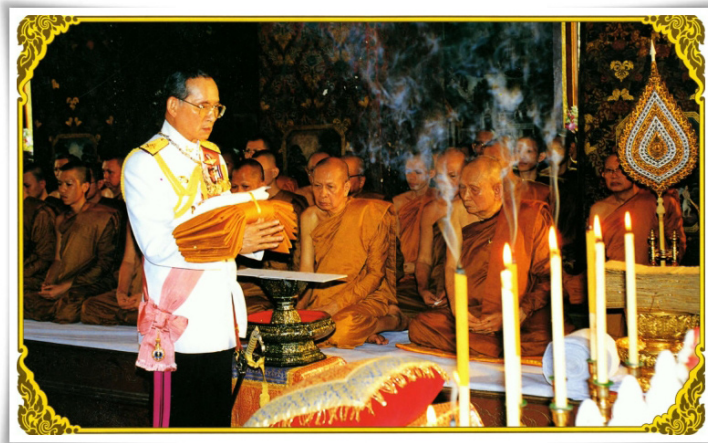
พระบาทสมเด็จพระเจ้าอยู่หัว ทรงบำเพ็ญพระราชกุศลถวายผ้าพระกฐิน

๑. พระกฐินหลวง เป็นพระราชกรณียกิจของพระมหากษัตริย์ผู้ทรงเป็นพุทธมามกะ และเอกอัครพุทธศาสนูปถัมภก เสด็จพระราชดำเนินถวายผ้าพระกฐินด้วยพระองค์เองหรือทรงพระกรุณาโปรดเกล้าฯ ให้สมเด็จพระราชินี พระราชโอรส พระราชธิดา เสด็จพระราชดำเนิน ทรงปฏิบัติพระราชกรณียกิจแทนพระองค์ รวมทั้งพระกฐินที่ทรงพระกรุณาโปรดเกล้าฯ ให้พระบรมวงศานุวงศ์ ราชสกุล องคมนตรี หรือผู้ที่ทรงพระราชดำริเห็นสมควรให้เสด็จฯ แทนพระองค์นำไปถวายยังพระอารามหลวงสำคัญ ๑๖ พระอาราม ที่สงวนไว้ไม่ให้มีการขอพระราชทาน คือ