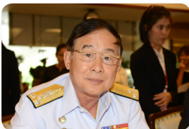
พล.ร.อ. ชุมพล วงศ์เวคิน ลำดับที่ ๐๔๐