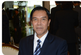
พล.อ. วีรณ ฉันทศาสตร์โกศล ลำดับที่ ๑๓๑