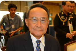
พล.อ.อ. ไพศาล สิตบุตตร ลำดับที่ ๑๐๐