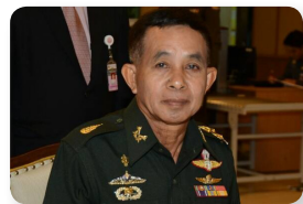
พล.อ. วินัย สร้างสุขดี ลำดับที่ ๒๑๐