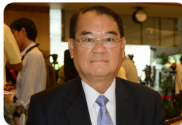
พล.ร.อ. วัลลภ เกิดผล ลำดับที่ ๑๒๒