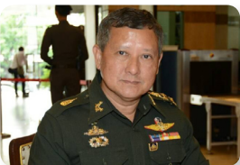
พล.อ. อุทิศ สุนทร ลำดับที่ ๒๒๐