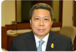
พล.อ. จิระเดช โมกขะสมิต ลำดับที่ ๐๒๓