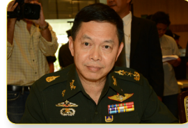
พล.อ. สุชาติ หนองบัว ลำดับที่ ๑๖๕