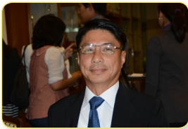
นายกรรณภว์ ธารรรคภวิน ลำดับที่ ๐๐๑

ในการนี้ ได้มีพระบรมราชโองการโปรดเกล้าฯ แต่งตั้งสมาชิกสภานิติบัญญัติแห่งชาติ เพิ่มเติมตามมาตรา ๖ ของรัฐธรรมนูญแห่งราชอาณาจักรไทย (ฉบับชั่วคราว) พุทธศักราช ๒๕๕๗ เมื่อวันที่ ๒๕ กันยายน ๒๕๕๗ จำนวน ๒๘ คน ทำให้มีสมาชิกสภานิติบัญญัติแห่งชาติ รวมทั้งสิ้น จำนวน ๒๒๐ คน ตามลำดับรายชื่อดังต่อไปนี้