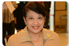
คุณหญิงทรงสุตา ยอดมณี ลำดับที่ ๐๕๑