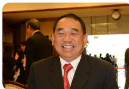
พล.อ.อ. ชนัท รัตนอุบล ลำดับที่ ๐๒๙