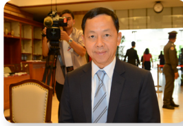
พล.ต.อ. วัชรพล ประสารราชกิจ ลำดับที่ ๑๑๙