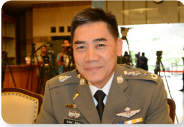
พล.ต.ท. จักรทิพย์ ชัยจินดา ลำดับที่ ๐๑๙