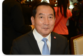
พล.อ.อ. อิทธิพร ศุภวงศ์ ลำดับที่ ๑๙๗