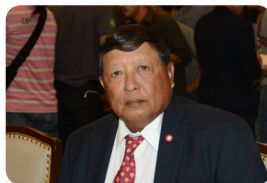
พล.อ.อ. ชาลี จันทร์เรือง ลำดับที่ ๐๓๘