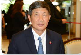
พล.อ. วิลาศ อรุณศรี ลำดับที่ ๑๒๘