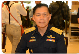
พล.อ.อ. ทรงธรรม โชคคณาพิทักษ์ ลำดับที่ ๐๕๐