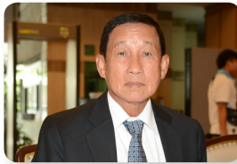
พล.อ. สมเจตน์ บุญถนอม ลำดับที่ ๑๕๘