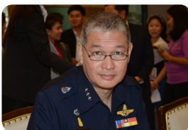
พล.อ.อ. จอม รุ่งสว่าง ลำดับที่ ๐๑๗