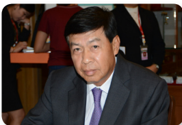
พล.อ.อ. ชนะ อยู่สถาพร ลำดับที่ ๐๒๘