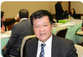
พล.อ. นพดล อินทปัญญา ลำดับที่ ๐๖๔