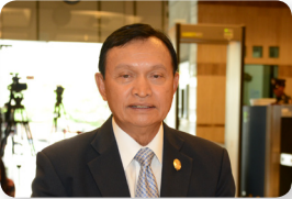
พล.อ. พิรุณ แผ้วพลสง ลำดับที่ ๐๙๔