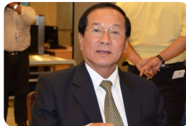
พล.อ. อรุณ สมตน ลำดับที่ ๒๑๘