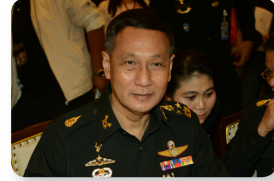
พล.อ. ไพบยนต์ คำทันเจริญ ลำดับที่ ๐๙๙