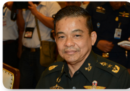
พล.ท. สุวโรจน์ ทิพย์มงคล ลำดับที่ ๑๓๖