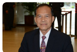
พล.ท. จเรศักดิ์ อานุภาพ ลำดับที่ ๐๔๒