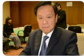
พล.ต.อ. พัชรวาท วงษ์สุวรรณ ลำดับที่ ๐๘๗