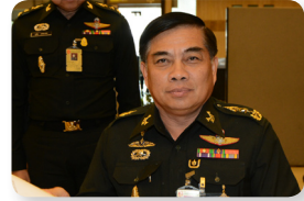
พล.ท. ภาณุวัชร นาควงษ์ ลำดับที่ ๑๐๕