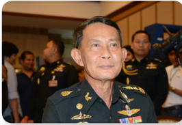
พล.อ. ปรีชา จันทร์โอชา ลำดับที่ ๐๘๒