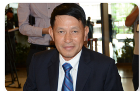
พล.อ.อ. ถาวร มณีพฤกษ์ ลำดับที่ ๐๔๘