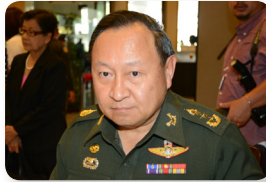
พล.ท. ศุภกร สงวนชาติศรไกร ลำดับที่ ๑๔๒