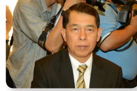
พล.ท. อำพน ชูประทุม ลำดับที่ ๑๙๕