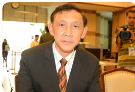
พล.อ. อนันตพร กาญจนรัตน์ ลำดับที่ ๑๔๔