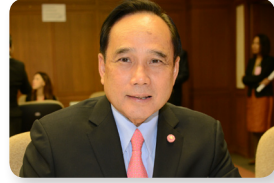
พล.ต.อ. พิเชิต ควรเดชะคุปต์ ลำดับที่ ๐๙๓