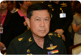
พล.ท. กิตติ อินทสร ลำดับที่ ๐๑๐