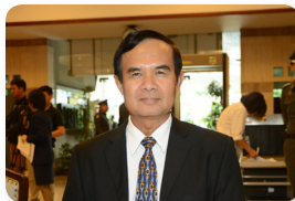
พล.ร.อ. นพดล โชकरดา ลำดับที่ ๐๖๕