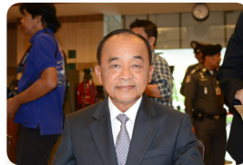
พล.อ. วีระวัฒน์ บุญยะประดับ ลำดับที่ ๐๖๒