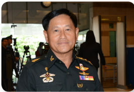
พล.อ. วลิต โรจนภักดี ลำดับที่ ๑๑๘