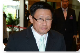
พล.ท. เทพพงศ์ ทิพยจันทร์ ลำดับที่ ๒๐๑