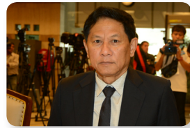
พล.อ. อภิษฐ์ หมั่นสวัสดิ์ ลำดับที่ ๑๔๐