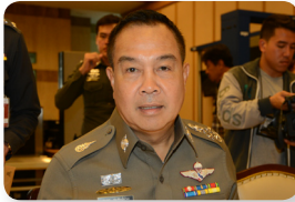
พล.ต.อ. สมยศ พุ่มพันธุ์ม่วง ลำดับที่ ๑๕๕