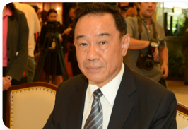
พล.อ. ทรงกิตติ จักกาบาตร์ ลำดับที่ ๐๔๙