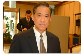
พล.อ. วรพงษ์ สง่าเนตร ลำดับที่ ๑๑๗