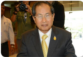
พล.อ. สุนทร ชำคมกุล ลำดับที่ ๒๑๔