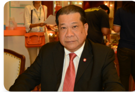
พล.อ. ไตรรัตน์ รังคะรัตน์ ลำดับที่ ๐๔๗