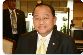
พล.อ. กิตติพงษ์ เกษโกวิท ลำดับที่ ๐๑๒