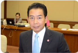
พล.ต. อภิรัชต์ คงสมพงษ์ ลำดับที่ ๒๑๗