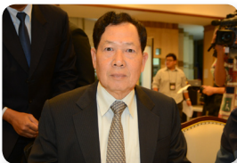
พล.อ.อ. บุญยฤทธิ์ เกิดสุข ลำดับที่ ๐๗๖