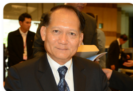
พล.อ.อ. สฤกษ์พงษ์ โคมุทานนท์ ลำดับที่ ๑๖๑