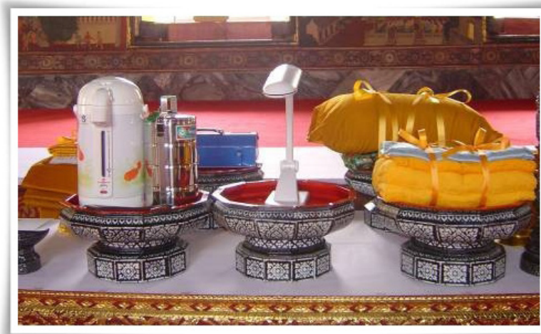
เครื่องบริวารพระกฐินพระราชทาน