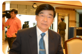
พล.อ. อุดยเดช อินทะพงษ์ ลำดับที่ ๑๔๓