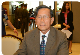
พล.อ. บุญสร้าง เนียมประดิษฐ์ ลำดับที่ ๐๗๗