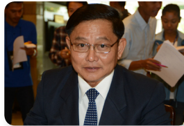
พล.ต. กู้เกียรติ ศรีนาคา ลำดับที่ ๐๑๔