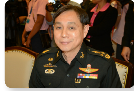
พล.อ. อักษรา เกิดผล ลำดับที่ ๑๘๙