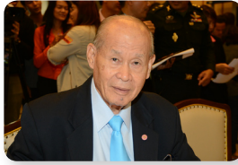
พล.ต. จารึก อารีราชการัณย์ ลำดับที่ ๐๒๐