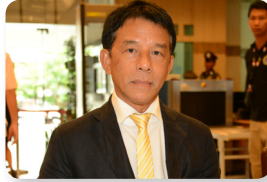
พล.ร.อ. ธราธร ขจิตสุวรรณ ลำดับที่ ๐๕๖