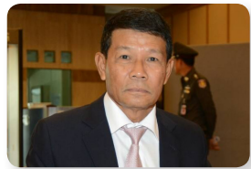
พล.อ. โปฏก บุนนาค ลำดับที่ ๒๐๔