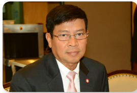
พล.อ. สมหมาย เกาฏีระ ลำดับที่ ๑๕๗