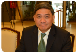
พล.อ. ทวีป เนตรนิยม ลำดับที่ ๐๕๒