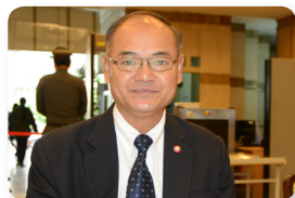
พล.อ. สิงห์ศึก สิงห์ไพร ลำดับที่ ๑๖๒