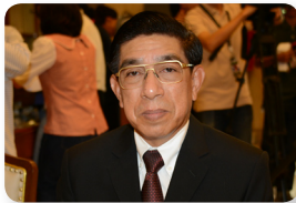
พล.ท. ชาทอุดม ติตถะสิริ ลำดับที่ ๐๓๗