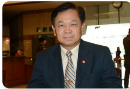
พล.อ. ศุภวุฒิ อุตมะ ลำดับที่ ๒๑๒