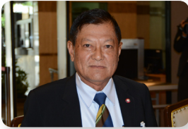
พล.อ.อ. อาคม กาญจนหิรัญ ลำดับที่ ๑๙๐