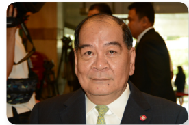
พล.อ. ยวนัญ สุริยกุล ณ อยุธยา ลำดับที่ ๑๑๔