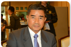
พล.ท. เฉลิมชัย สิทธิสาท ลำดับที่ ๐๒๗