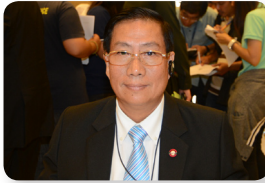
พล.อ. มารุต ปิโซตตะสิงห์ ลำดับที่ ๑๑๐