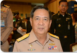
พล.ร.อ. พลวัฒน์ สีโรดม ลำดับที่ ๐๙๑