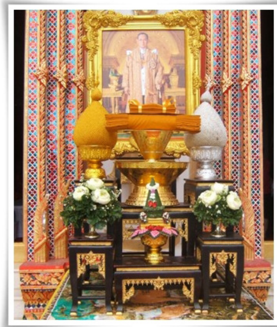
โต๊ะหมู่บูชาพระบรมฉายาลักษณ์ พิธีถวายผ้าพระกฐินพระราชทาน

จากกองศาสนูปถัมภ์ กรมการศาสนา เพื่อนำไปทอด ณ พระอารามที่ขอรับพระราชทานไว้ เมื่อทอดถวายเรียบร้อยแล้วผู้ขอรับพระราชทานจะต้องจัดทำบัญชีรายงานถวายพระราชกฐล ในการถวายผ้าพระกฐินพระราชทาน ส่งไปยังกรมการศาสนา เพื่อจะได้จัดทำบัญชีรายชื่อ ผู้ขอรับพระราชทานผ้าพระกฐิน ส่งไปยังสำนักเลขาธิการนายกรัฐมนตรี เพื่อแจ้งให้ สำนักราชเลขาธิการนำความกราบบังคมทูลพระกรุณาทราบฝ่าละอองธุลีพระบาท เพื่อถวาย พระราชกฐลในการที่หน่วยงาน องค์กรหรือบุคคลทั่วไป อัญเชิญผ้าพระกฐินไปถวาย ณ อารามนั้น