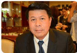
พล.ท. ชาญชัย ภูทอง ลำดับที่ ๐๓๕