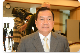
พล.อ. วิชญ์ เทพหัสดิน ณ อยุธยา ลำดับที่ ๑๒๓