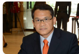
พล.ท. พิศณุ พุทธวงศ์ ลำดับที่ ๒๐๖