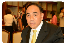
พล.ท. กัมปนาท รุดดิษฐ์ ลำดับที่ ๐๐๖