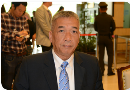
พล.ร.ท. สนธยา น้อยฉายา ลำดับที่ ๑๔๖