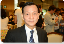
พล.ต.ท. วิบูลย์ บางท่าไม้ ลำดับที่ ๑๒๗