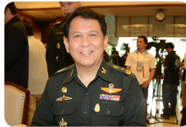
พล.อ. นิวัตติ ศรีเพ็ญ ลำดับที่ ๐๗๑