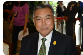
พล.อ. วีระเดช มีเพียร ลำดับที่ ๐๖๓