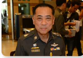
พล.ต.อ. เอก อังสนานนท์ ลำดับที่ ๒๐๐