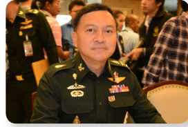
พล.อ. นิพัทธ์ ทองเล็ก ลำดับที่ ๐๖๙