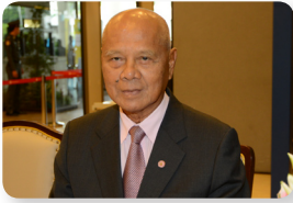
พล.อ. อู๊ด เบื้องบน ลำดับที่ ๑๙๙