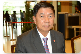
พล.อ. ยอดยุทธ บุญญาธิการ ลำดับที่ ๑๑๑