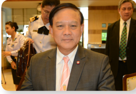
พล.ร.อ. อมรเทพ ฌ บางช้าง ลำดับที่ ๑๘๗