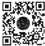
หนังสือนัดประชุม และระเบียบวาระการประชุม ร่วมกันของรัฐสภา

๒. รายงานการประชุมร่วมกันของรัฐสภา ครั้งที่ ๑ (สมัยสามัญประจำปีครั้งที่สอง) ได้วางให้สมาชิกรัฐสภา ตรวจสอบเมื่อวันพฤหัสบดีที่ ๒๐ มิถุนายน ๒๕๖๗ ณ บริเวณหน้าห้องประชุมสภาผู้แทนราษฎร ชั้น ๒ สำนักงานเลขาธิการสภาผู้แทนราษฎร และห้องรับรองสมาชิกวุฒิสภา ชั้น ๒ สำนักงานเลขาธิการวุฒิสภา ก่อนเสนอให้ที่ประชุมร่วมกันของรัฐสภารับรอง รวมทั้งเสนอให้สมาชิกรัฐสภาตรวจสอบทางสื่ออิเล็กทรอนิกส์ หรือสื่อเทคโนโลยีสารสนเทศอื่นอีกทางด้วยแล้วตามข้อบังคับการประชุมรัฐสภา พ.ศ. ๒๕๖๓ ข้อ ๒๓