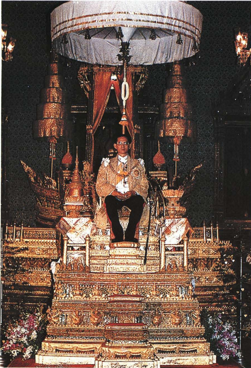
พระบาทสมเด็จพระปรมินทรมหาภูมิพลอดุลยเดชฯ