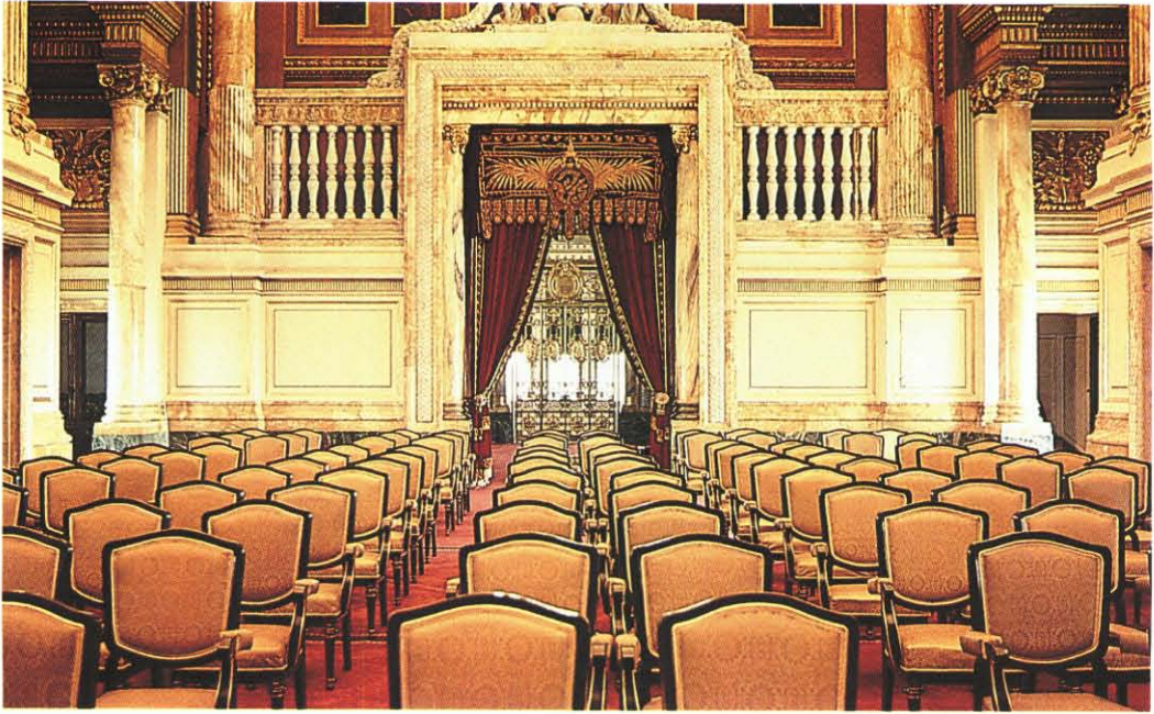
ก่อนรัฐพิธีเปิดประชุมรัฐสภา