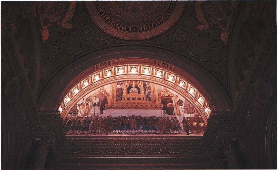
เพดานอันงดงาม : บนเพดานจารึกพระปรมาภิไธยพระบาทสมเด็จพระจุลจอมเกล้าเจ้าอยู่หัว และพระบาทสมเด็จพระมงกุฎเกล้าเจ้าอยู่หัว