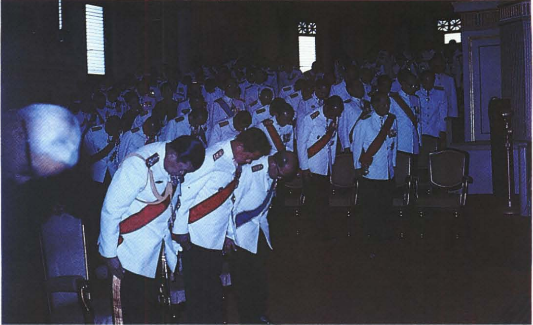
สมาชิกวุฒิสภา : ในรัฐพิธีเปิดประชุมวุฒิสภา