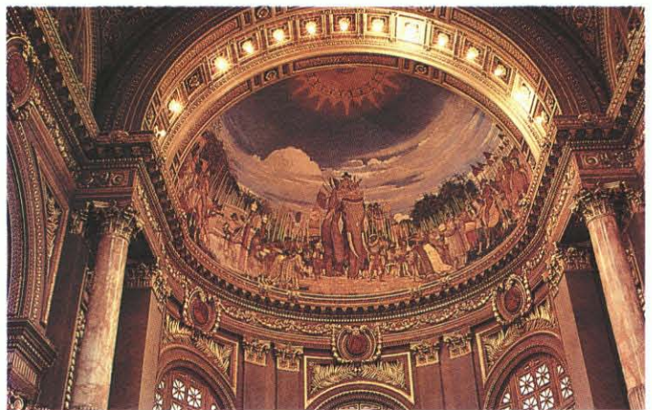
ศิลปะอันวิจิตรงดงามบริเวณโดมกลางห้องพระโรง