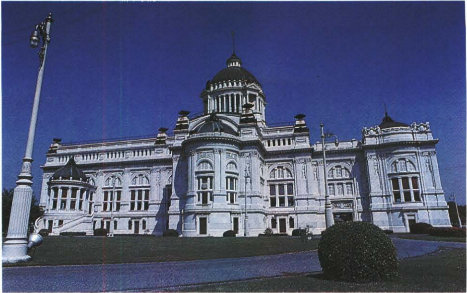
พระที่นั่งอนันตสมาคม : สถานที่ทรงประกอบรัฐพิธีเปิดประชุมรัฐสภา