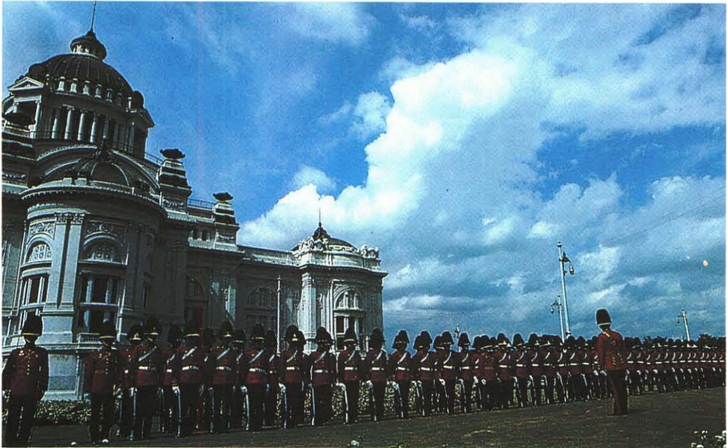
ทหารมหาดเล็กรักษาพระองค์ ในรัฐพิธีเปิดประชุมรัฐสภา