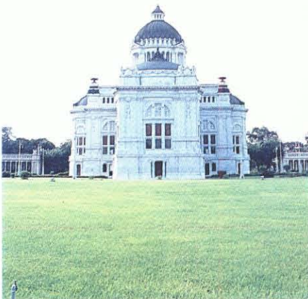
พระที่นั่งอนันตสมาคม มุมมองทิศตะวันออก