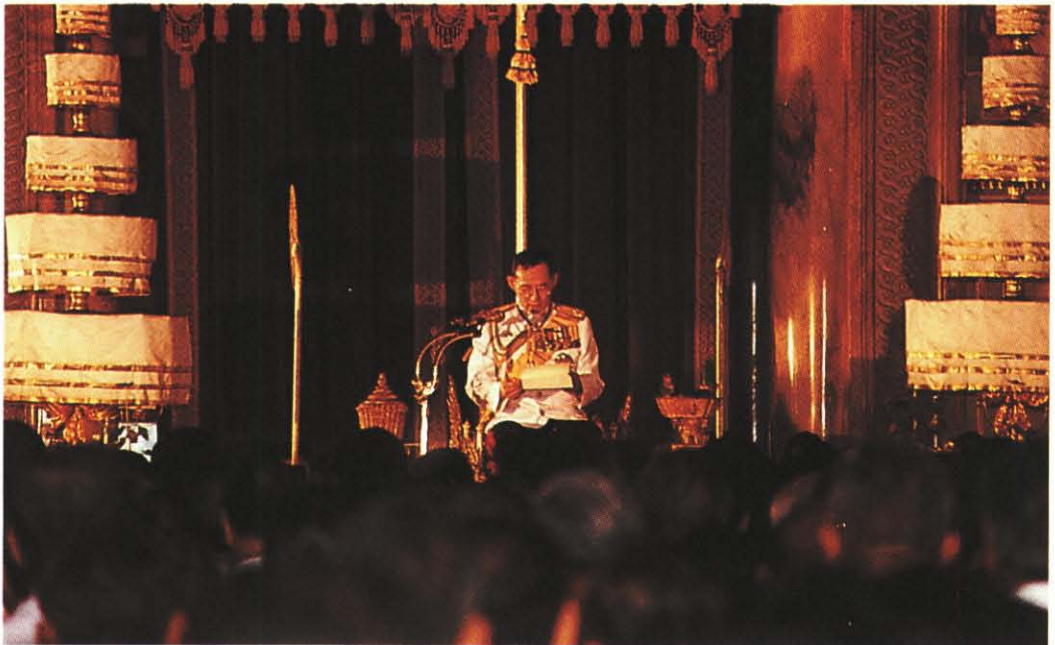
พระบาทสมเด็จพระปรมินทรมหาภูมิพลอดุลยเดชฯ พระราชทานพระราชดำรัส เนื่องในวโรกาสเสด็จพระราชดำเนินทรงประกอบรัฐพิธีเปิดประชุมรัฐสภา