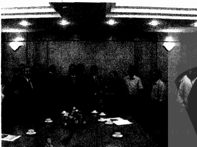
บรรยากาศภายในห้องสนทนา ณ ที่ทำการของคณะกรรมการประชาชนกรุงเทพมหานคร