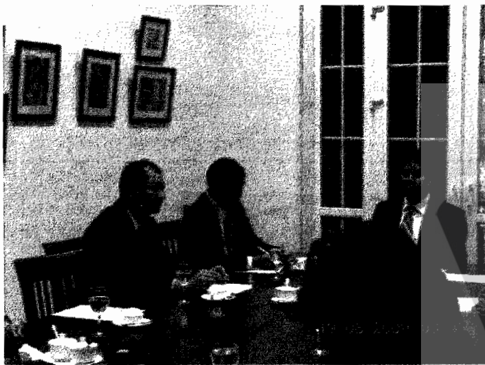
บรรยากาศภายในห้องสนทนา ณ สถานเอกอัครราชทูตไทย กรุงเทพมหานคร