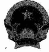
ตราแผ่นดินของเวียดนาม

เวียดนาม (Viet Nam) หรือชื่อทางการคือ สาธารณรัฐสังคมนิยมเวียดนาม (Cong Hoa Xa Hoi Chu Nghia Vibt Nam) เป็นประเทศในเอเชียตะวันออกเฉียงใต้ มีพรมแดนติดกับประเทศจีน ทางทิศเหนือ ประเทศลาว และประเทศกัมพูชา ทางทิศตะวันตก และอ่าวตังเกี๋ย ทะเลจีนใต้ ทางทิศตะวันออก